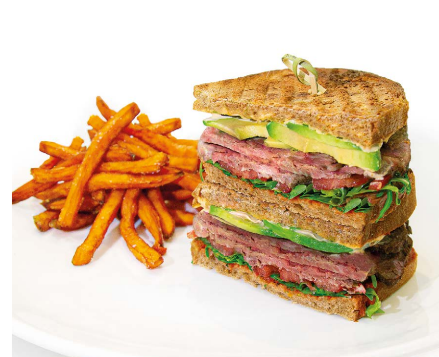
Сэндвич с ростбифом и бататом фри Roast beef sandwich with sweet potato fries 280/80 g 1290P