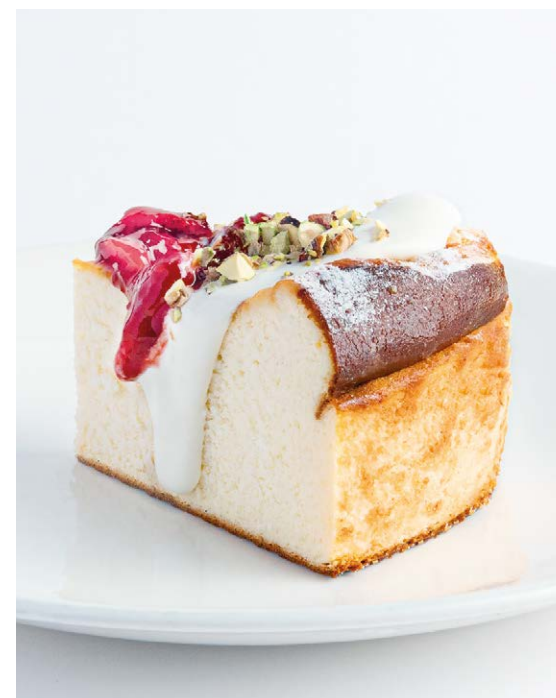
Творожная запеканка со сметаной и клубничным вареньем Farmer's cheese cake with sour cream & strawberry jam 150/40 g 640P