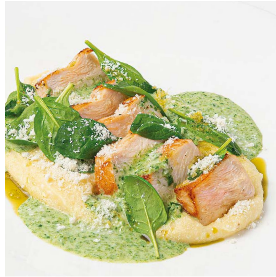
Куриная грудка с пюре и соусом шпинат-горгонзола Chicken breast with spinach gorgonzola sauce & mashed potatoes 100/180 g 820P