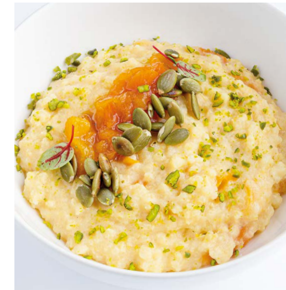
Каша пшенная с курагой Millet porridge with dried apricots 320 g 520P