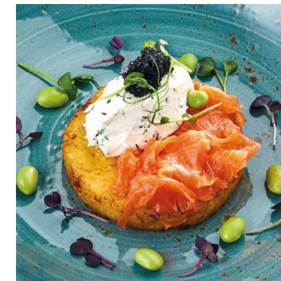
Драник с лососем «Dranik» with salmon 145/30 g 770P