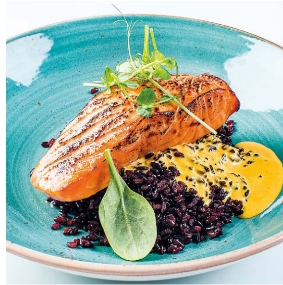
Лосось с черным рисом Salmon with black rice 85/150 g 1350P