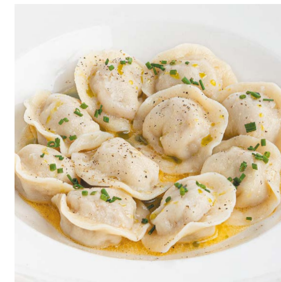
Пельмени с говядиной Beef dumplings 200/30 g 700P