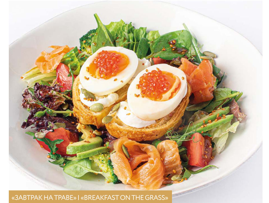
«ЗАВТРАК НА ТРАВЕ» | «BREAKFAST ON THE GRASS»