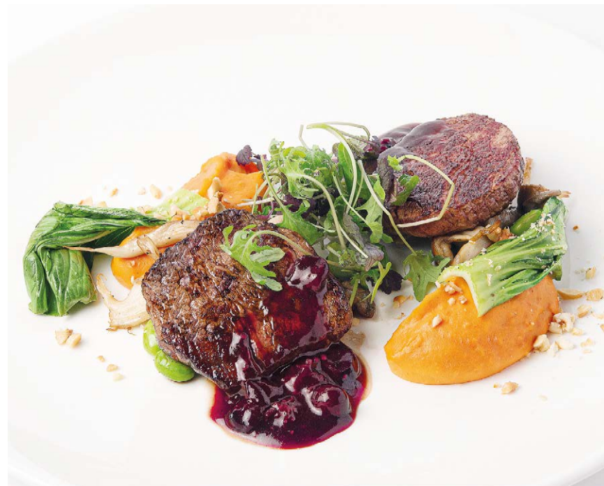
Медальоны с пюре из корнеплодов Medallions with mashed root vegetables 120*/150 g 1350P