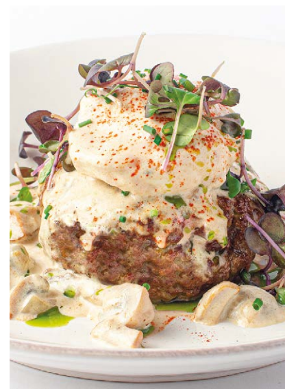
Бифштекс с белыми грибами, яйцом пашот и лепешкой роти парата Beefsteak with porcini mushrooms, poached egg and roti paratha flatbread 150/100/70 g 990P