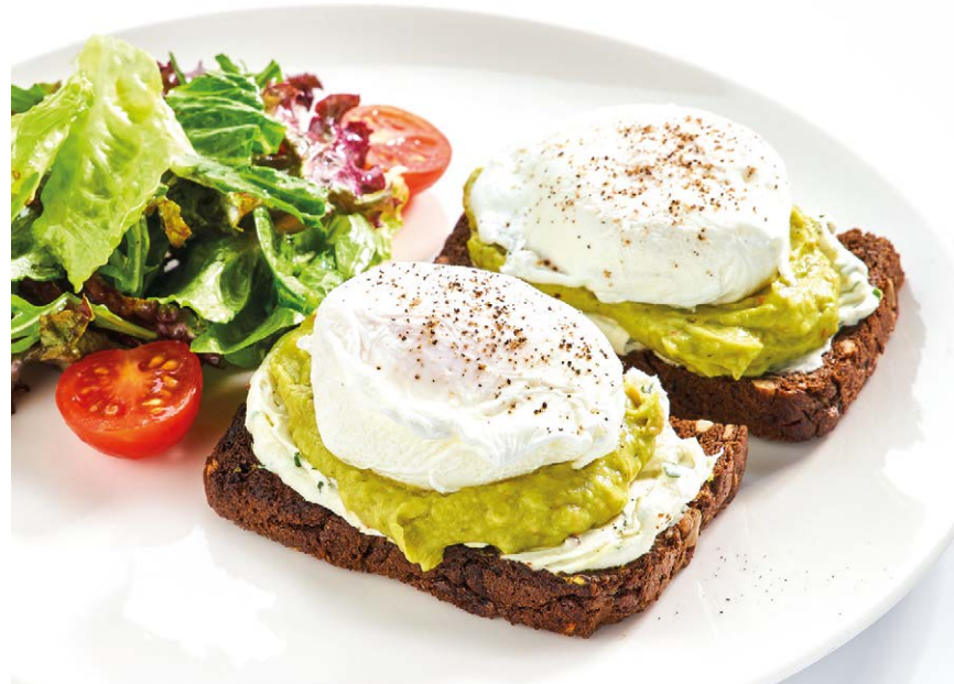
Яйца пашот на тостах из черного злакового хлеба с крем-чизом Poached eggs with cream cheese on cereal bread toasts 250 g 296 kcal 650P