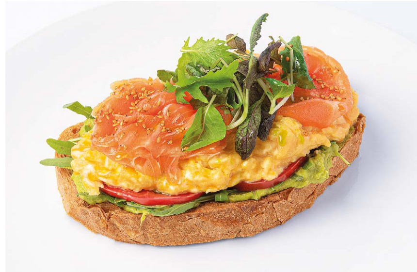
Скрембл на ржаном тосте с гуакамоле Scrambled eggs on rye toast with guacamole - с лососем / with salmon 380 g - с пармой / with parma ham 380 g - с пастромой из индейки / with turkey pastrami 380 g