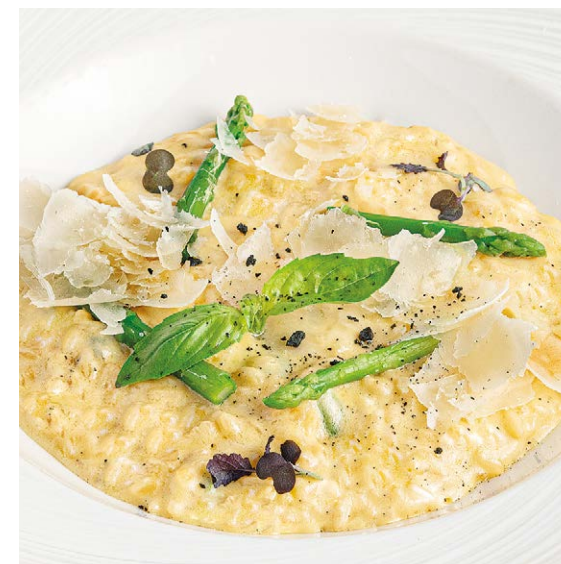
Ризотто 4 сыра Four cheese risotto 300 g 840P