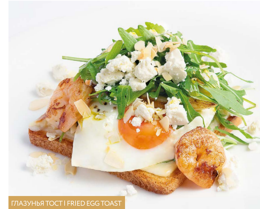
ГЛАЗУНЯ ТОСТ | FRIED EGG TOAST