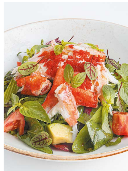
Камчатский краб с авокадо, страчателлой, томатами и икрой летучей рыбы Kamchatka crab with avocado, stracciatella, tomatoes & flying fish roe 260 g 1290P