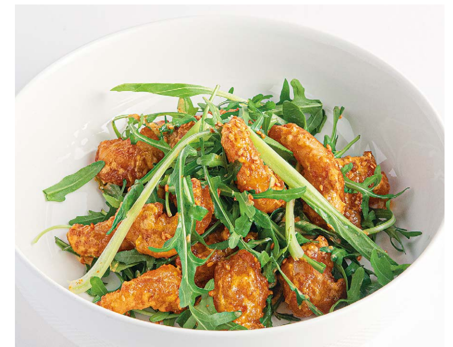
Креветки попкорн Popcorn shrimp 140/20 g 780P