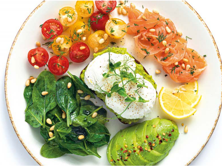
«Завтрак Чемпиона» с яйцом пашот, лососем и авокадо «Champion's breakfast» with poached egg, salmon & avocado 300 g 335 kcal 890P