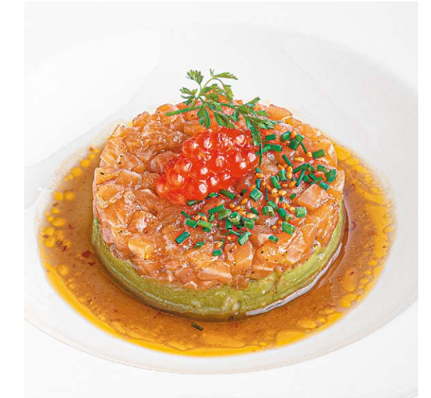
Тартар из лосося Salmon tartare 150/15 g 870P