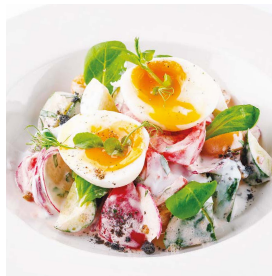
Овощной салат Vegetable salad 270 g 149 kcal 670P