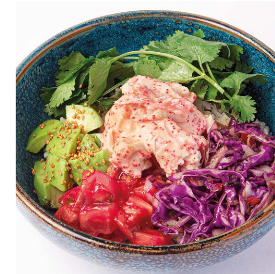
Теплый боул с крабом и яйцом пашот Warm crab bowl with poached egg 380 g 1150P