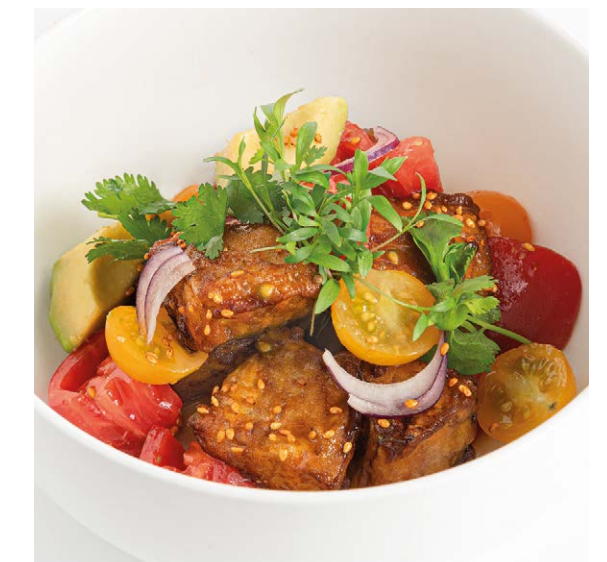
Хрустящие баклажаны Crispy eggplants 190 g 790P