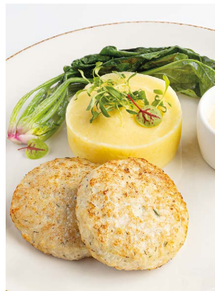
Куриные котлеты с трюфельным пюре Chicken cutlets with truffle mashed potatoes 110/160/40 g 790P