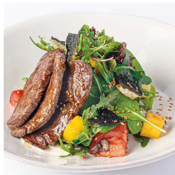
Азиатский салат с мраморной говядиной Asian salad with marbled beef 210 g 1050P