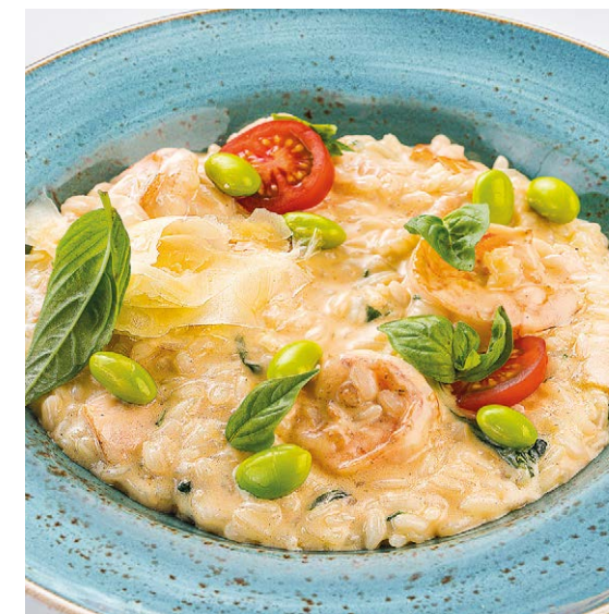
Ризотто с лососем и креветками Risotto with prawns & salmon 320 g 990P