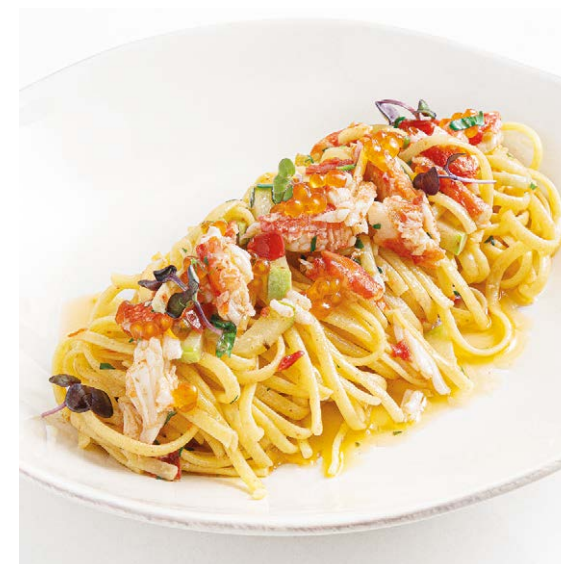
Лингвини с крабом Linguine with crab 330 g 1300P