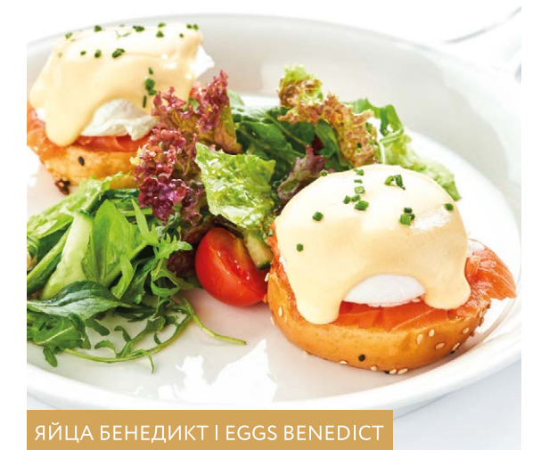
ЯЙЦА БЕНЕДИКТ | EGGS BENEDICT