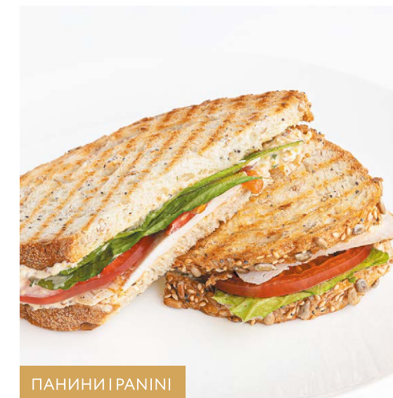
ПАНИНИ | PANINI - с беконом / with bacon 240 g 570P - с курицей / with chicken 230 g 570P - с индейкой / with turkey 225 g 570P