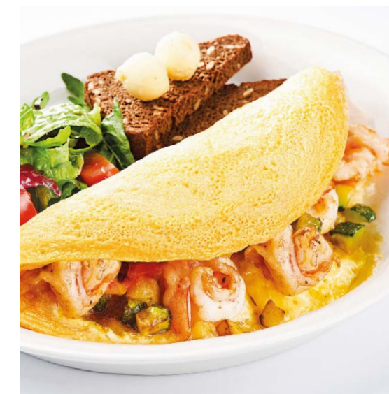
Омлет «Санта Фэ» с креветками, цукини и крем-чизом Omelette «Santa Fe» with prawns, zucchini & cream cheese 280/80 g 830P