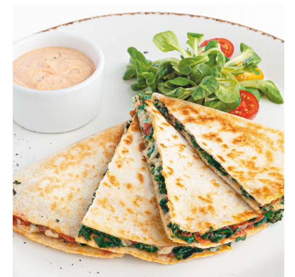
Кесадилья со шпинатом и моцареллой Spinach & mozzarella quesadilla 270/40/25 g 820P

По вашему желанию мы можем приготовить блюдо острым We can make the dish spicy if you wish