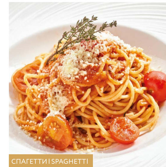
- с лососем и креветками / with salmon & prawns 300 g 970P - с креветками / with prawns 280 g 870P