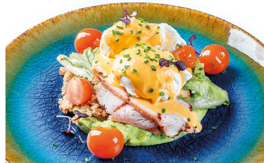
Завтрак «Фаворит» с киноа, яйцом пашот и пастромой из индейки «Favorite» breakfast with quinoa, poached egg & turkey pastrami 330 g 790P