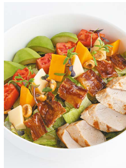
Кобб салат с индейкой и карамелизированным беконом Cobb salad with turkey & caramelized bacon 370 g 890P