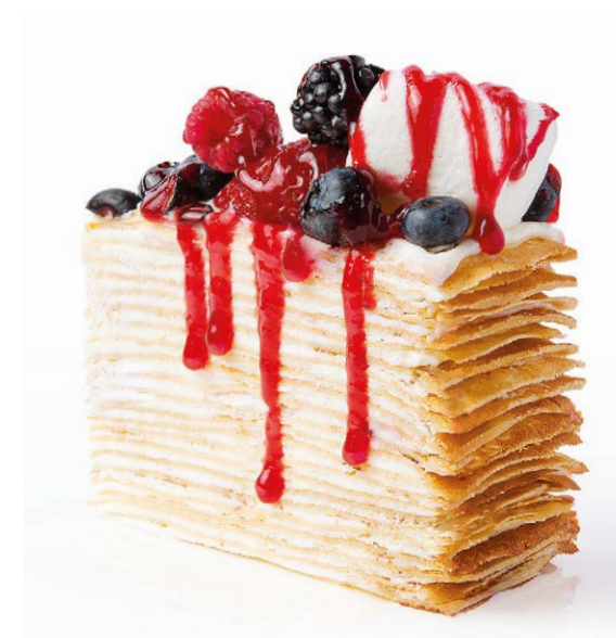
Торт блинный с ягодами Crepe cake with berries 250 g 780P

Клубника-ваниль Strawberry vanilla 145 g 760P