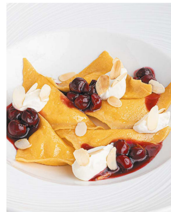
Вареники с творогом «Vareniki» with cottage cheese 90/60 g 570P