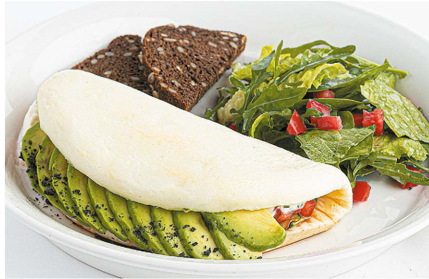
Белковый омлет с авокадо Protein omelette with avocado 300/50 g 329 kcal 790P