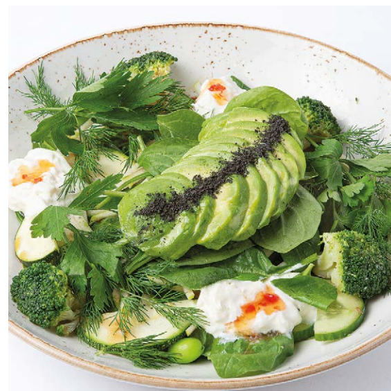
Большой зеленый салат со страчателлой Big green salad with stracciatella 310 g 890P - с куриной грудкой / chicken breast 370 g 990P - с креветками / with prawns 350 g 1020P