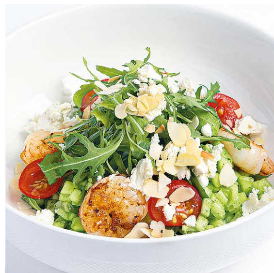
Рукола с креветками, сыром фета и соусом песто Arugula salad with shrimp, pesto & feta cheese 230 g 364 kcal 770P