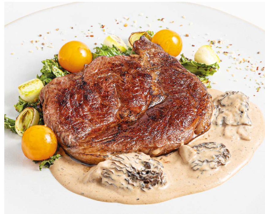
Стейк Рибай Ribeye steak 200*/100 g 2250P