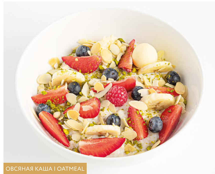
ОВСЯНАЯ КАША | OATMEAL