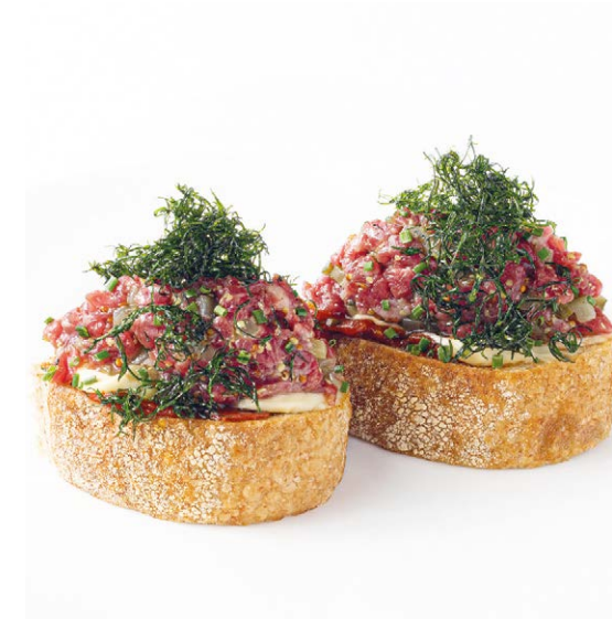
Тартар из говядины на гречишной брусчетте Beef tartare on buckwheat bruschetta 130 g 810P