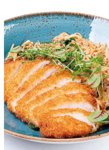
Рамен с цыпленком Chicken ramen noodles 420 g 840P