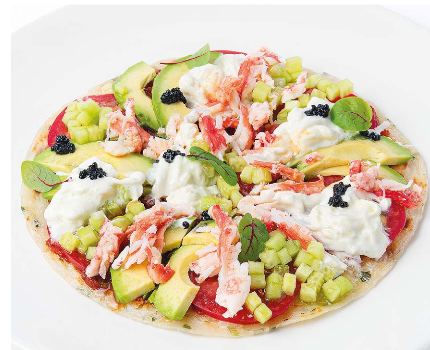
Краб и страчателла на лепешке роти парата с авокадо, огурцом, томатами Crab and stracciatella cheese on a flatbread paratha with avocado, cucumber & tomatoes 310 g 1300P