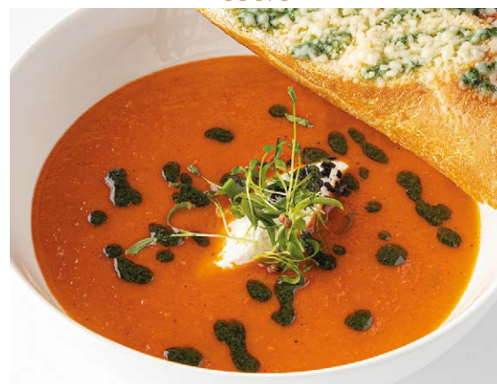
Томатный суп с рикоттой / Tomato soup with ricotta 250/40 g 690P