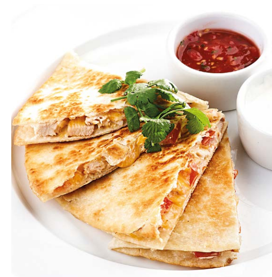
Кесадилья с курицей Chicken quesadilla 210/50/50 r 790P