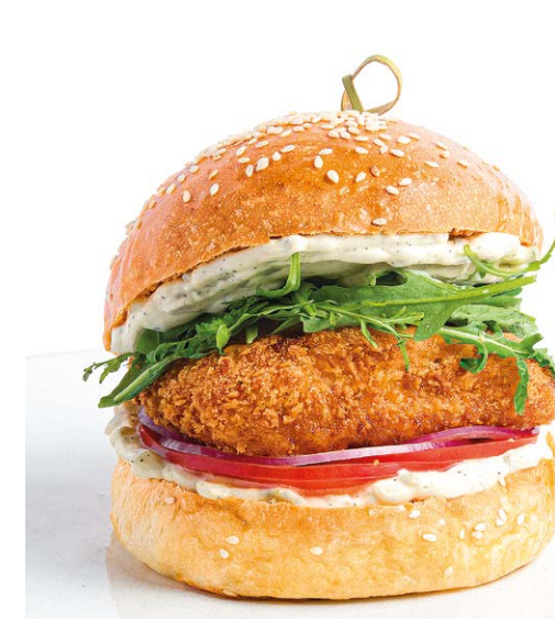
Фишбургер Fish burger 260 r 790P