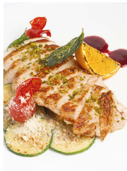
Стейк из индейки с цукини и вишневым соусом Turkey steak with zucchini and cherry sauce 140/110 r 890P