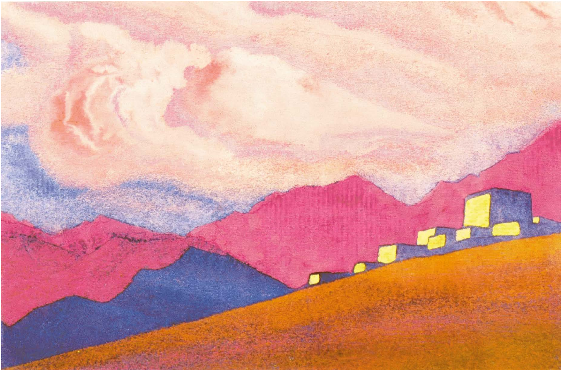
Н. К. РЕРИХ «ТИБЕТ»