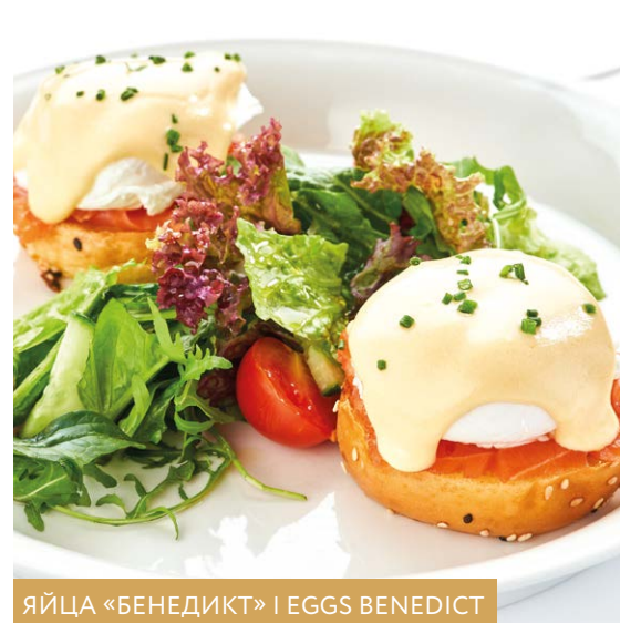
ЯЙЦА «БЕНЕДИКТ» | EGGS BENEDICT