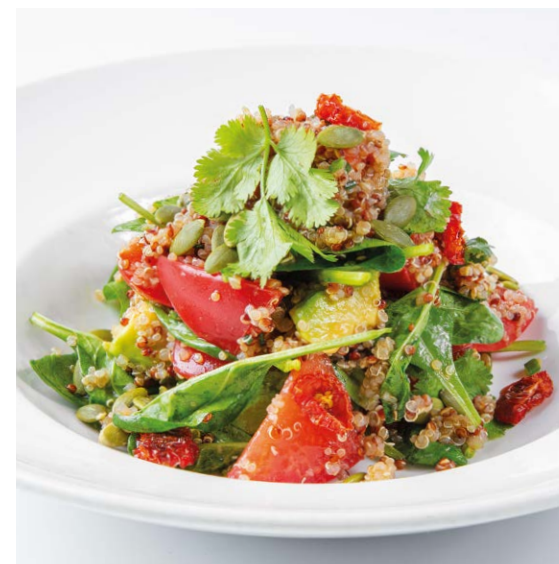
Киноа с томатами и авокадо Quinoa with tomatoes & avocado 250 г 239 ккал 720P