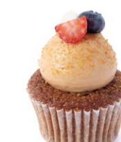
Сметанник Sour cream 30 r