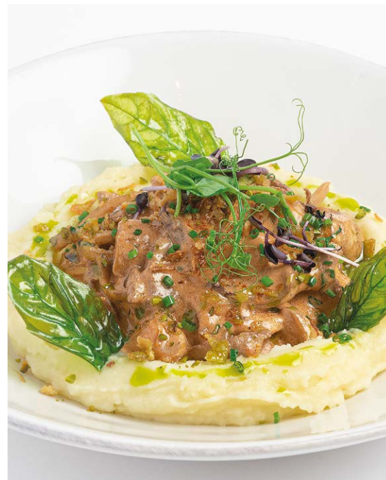
Бефстроганов с белыми грибами и пюре Beef Stroganoff with porcini mushrooms and mashed potatoes 140/140 r 1290P