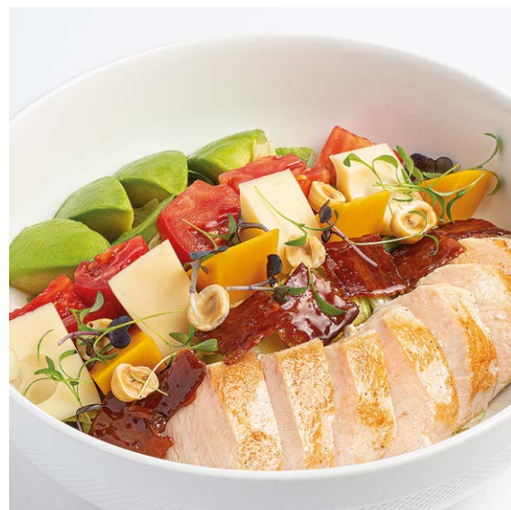
Салат с индейкой, авокадо и томатами Salad with turkey, avocado and tomatoes 360 r 990P