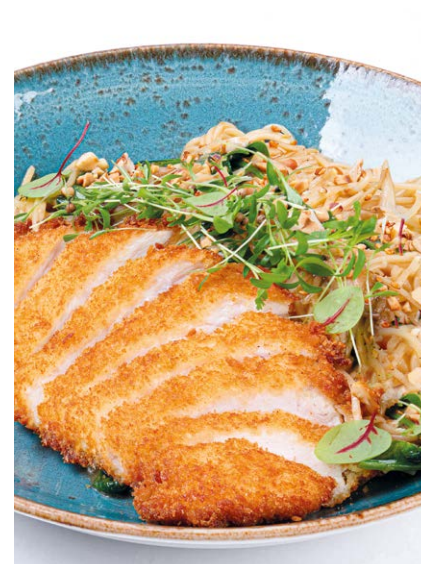
Рамен с цыпленком Chicken ramen noodles 420 r 890P