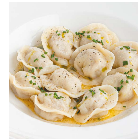
Пельмени с говядиной Beef dumplings 200/30 r 750P