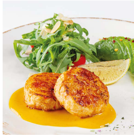
Котлеты из краба с авокадо Crab cakes with avocado 100/100 r 990P