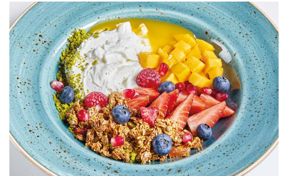
Творожный мусс с ягодами и манго Cottage cheese mousse with berries and mango 230 г 790P