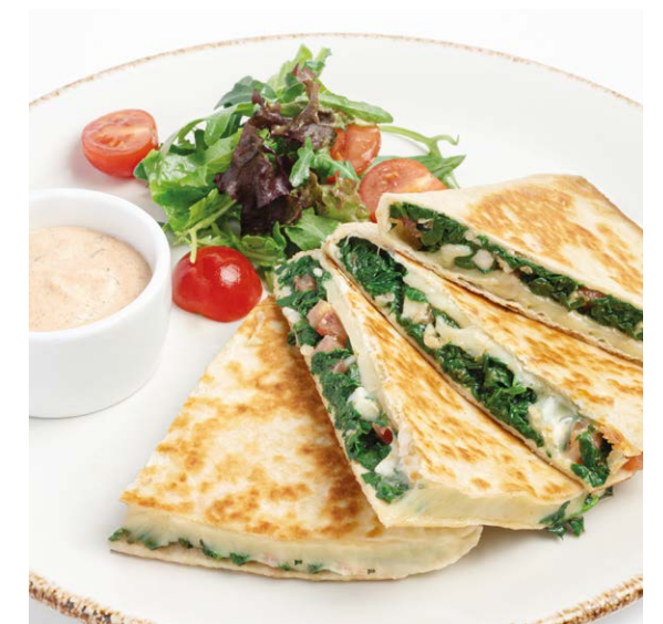
Кесадилья со шпинатом и моцареллой Spinach & mozzarella quesadilla 270/40/25 r 890P

По вашему желанию мы можем приготовить блюдо острым We can make the dish spicy if you wish