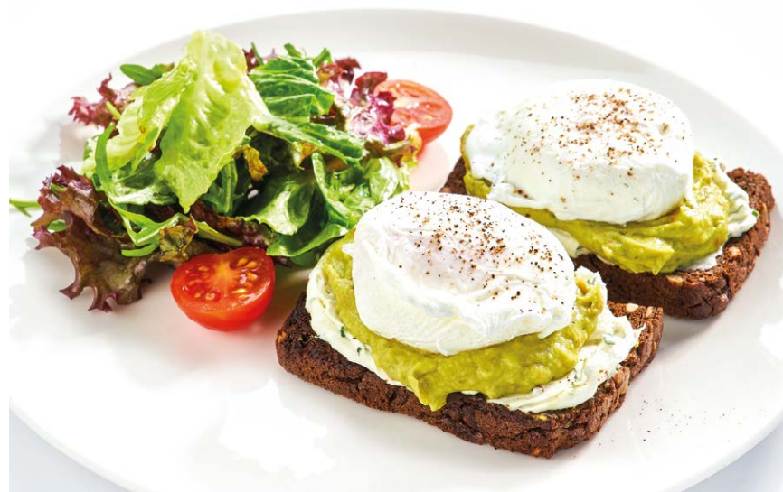
Яйца пашот на тостах из черного злакового хлеба с творожным сыром Poached eggs with cream cheese on cereal bread toasts 250 г 296 ккал 690P