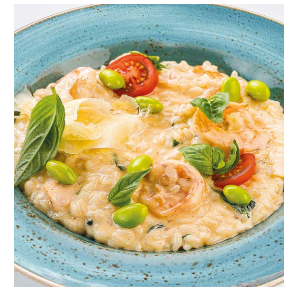
Ризотто с лососем и креветками Risotto with prawns & salmon 320 r 1090P