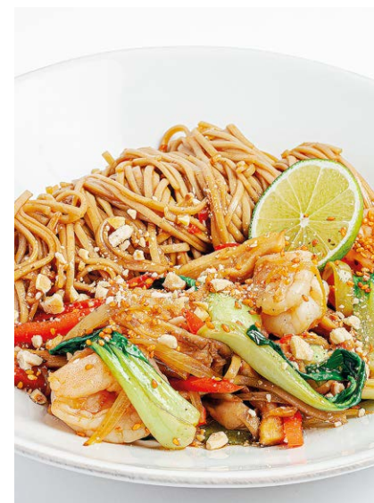
Гречневая лапша с креветками и вешенками Buckwheat noodles with shrimp and oyster mushrooms 330 r 940P