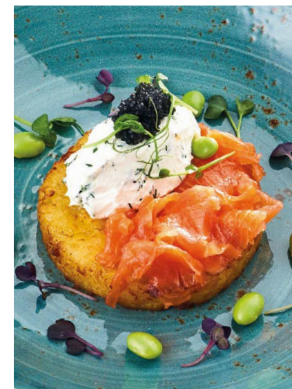
Драник с лососем "Dranik" with salmon 145/30 r 790P