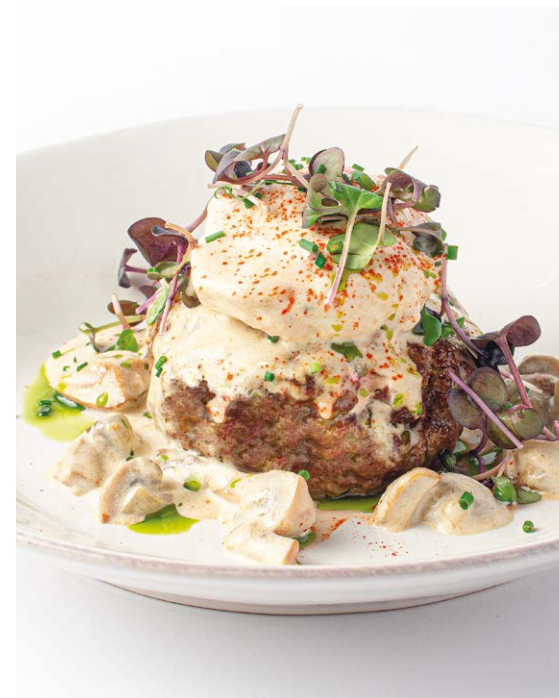
Бифштекс с белыми грибами, яйцом пашот и лепешкой роти парата Beefsteak with porcini mushrooms, poached egg and roti paratha flatbread 150/100/70 r 1190P