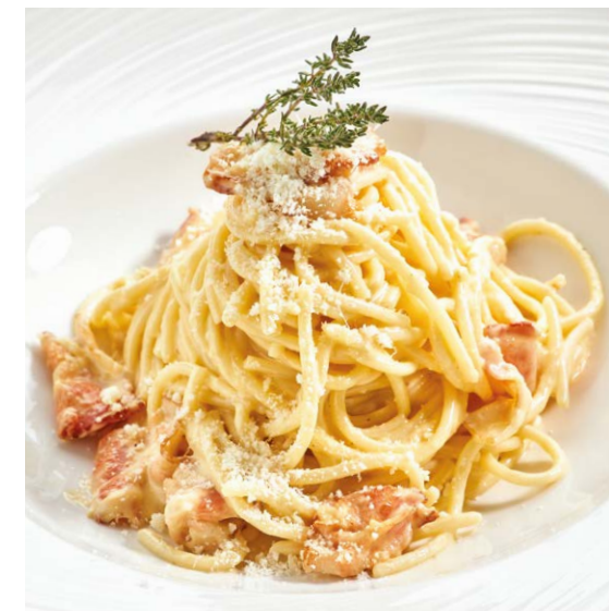
Спагетти Карбонара Spaghetti Carbonara 230 r 770P

с лососем и креветками / with salmon & prawns 300 r 1090P с креветками / with prawns 280 r 990P