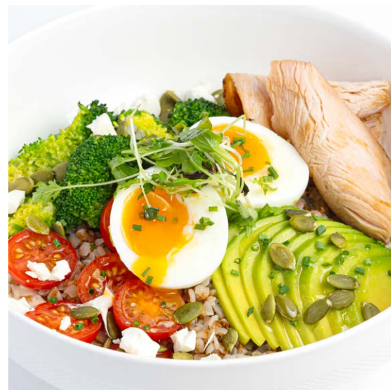
Завтрак «Баланс» Breakfast "Balance" 290 r 790P - с креветками / with prawns 325 r 960P - с индейкой пастроми / with turkey pastrami 320 r 920P