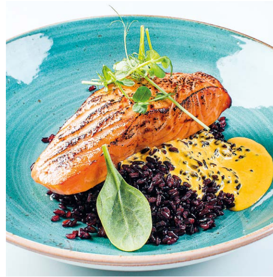
Лосось с черным рисом Salmon with black rice 85/150 r 1390P