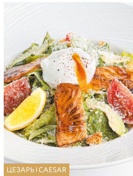
ЦЕЗАРЬ | CAESAR

- с лососем / with salmon 300 r 1250P - с креветками / with prawns 270 r 920P - с курицей / with chicken 270 r 890P