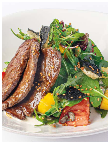
Азиатский салат с мраморной говядиной Asian salad with marbled beef 210 r 1190P