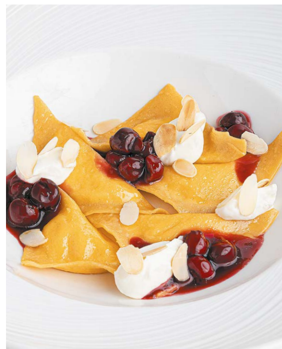
Вареники с творогом "Vareniki" with cottage cheese 90/60 r 620P