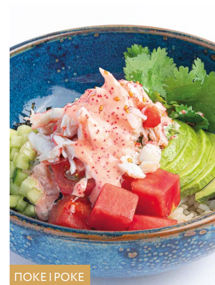
ПОКЕ | POKE