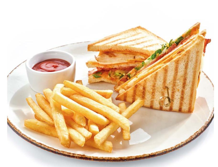
Сэндвич с курицей, беконом, яйцом и картофелем фри Sandwich with chicken, bacon, egg & French fries 250/80/30 r 820P