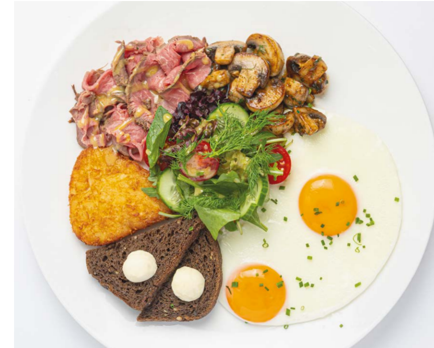
Завтрак «Атлант» с ростбифом и глазуньей "Atlas breakfast" with roast beef & fried egg 300 г 1070P