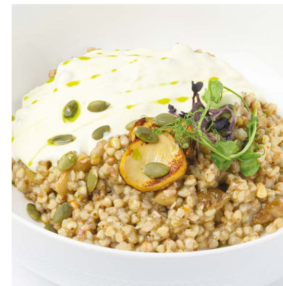
Гречотто с белыми грибами, кедровым орехом и муссом из пармезана Buckwheat risotto with porcini mushrooms, pine nuts and parmesan mousse 330 r 840P

Картофельное пюре Mashed potatoes 150 r 350P