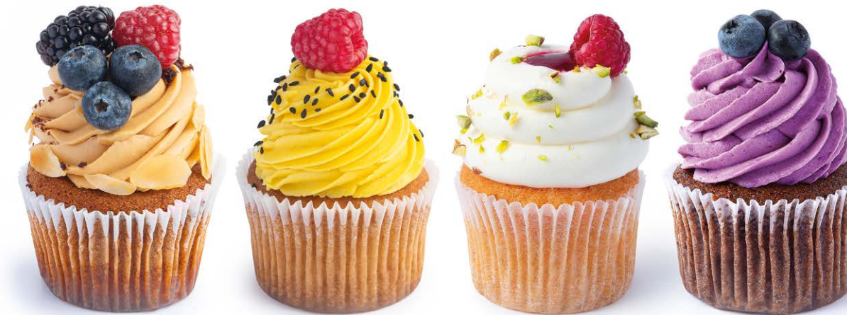
Сметанник с ягодами Sour cream with berries 135 r