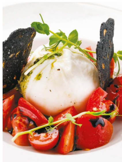
Мягкий сыр буррата с томатами Burrata soft cheese with tomatoes 230 r 990P