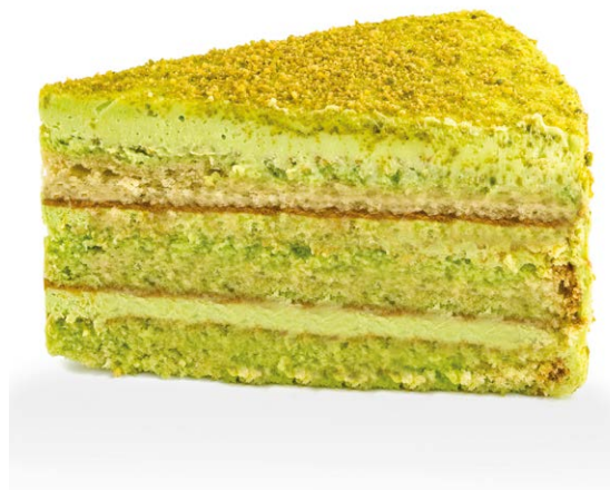
Фисташковый торт Pistachio cake 170 r 680P