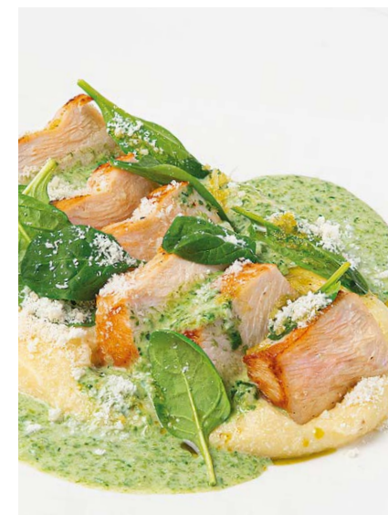
Куриная грудка с пюре и соусом из голубого сыра и шпината Chicken breast with mashed potatoes & blue cheese spinach sauce 100/180 r 890P