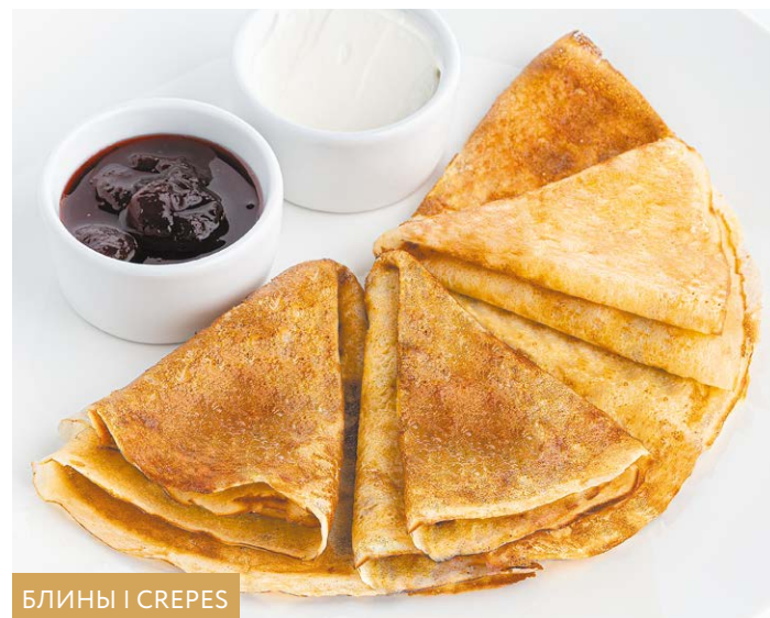
БЛИНЫ | CREPES