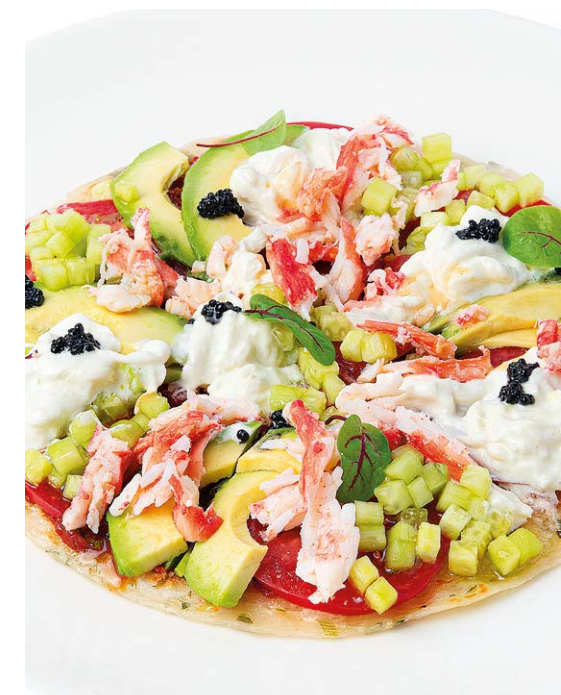
Краб и сыр страчателла на лепешке роти парата с авокадо, огурцом, томатами Crab and stracciatella cheese on a flatbread paratha with avocado, cucumber & tomatoes 310 r 1390P