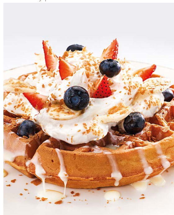
Бельгийские вафли Belgian waffles 400 r 790P