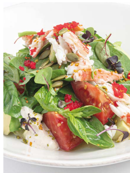
Камчатский краб с авокадо, ореховым соусом и икрой летучей рыбы Kamchatka crab with avocado, nut sauce & flying fish roe 260 r 1290P