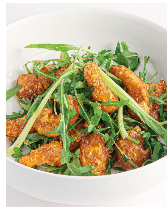
Креветки попкорн Popcorn shrimp 140/20 r 790P