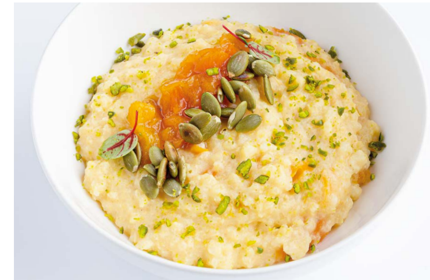
Каша пшенная с курагой Millet porridge with dried apricots 320 г 550P