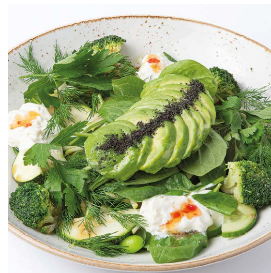
Большой зеленый салат Big green salad 310 г 373 ккал 890P - с куриной грудкой / chicken breast 370 г 435 ккал 990P - с креветками / with prawns 350 г 425 ккал 1070P