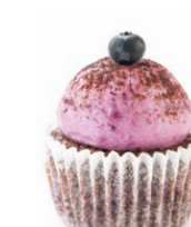
Черничный Blueberry 25 r