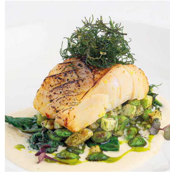
Атлантическая треска со сливочным соусом берблан Atlantic cod with creamy beurre blanc sauce 110/100 r 1190P