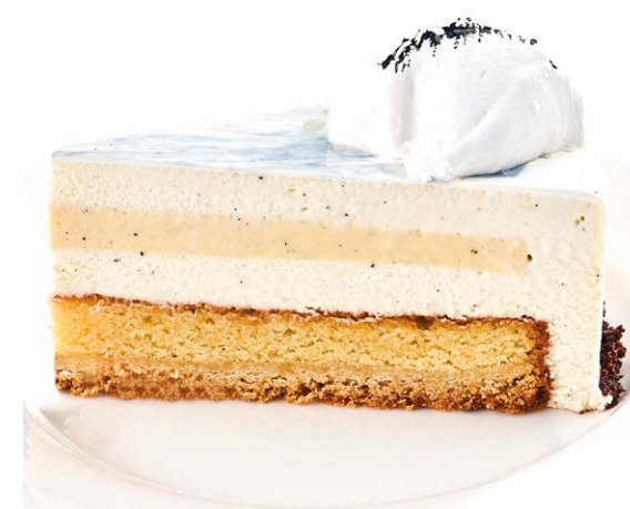
Пломбир Plombir cake 170 r 680P