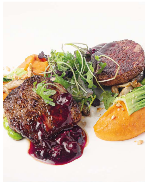
Медальоны с пюре из корнеплодов Medallions with mashed root vegetables 120*/150 r 1390P