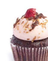
Черный лес Black Forest 27 r