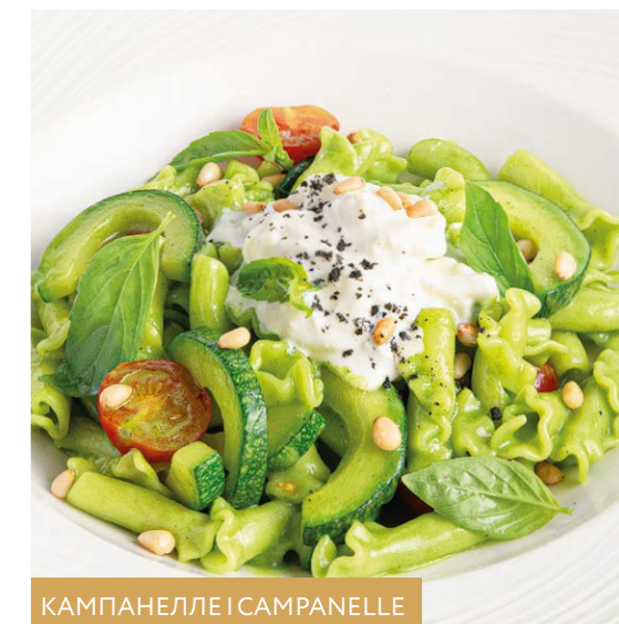
КАМПАНЕЛЛЕ | CAMPANELLE

- с мягким сыром страчателла / with stracciatella 330 r 890P - с мягким сыром страчателла и куриной грудкой / with stracciatella & chicken breast 390 r 990P - с мягким сыром страчателла и креветками / with stracciatella & shrimp 360 r 1070P