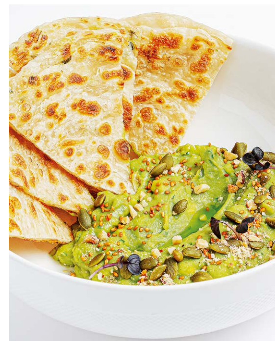
Хумус из авокадо с лепешкой роти парата Avocado hummus with rotini paratha flatbread 110/70 r 670P