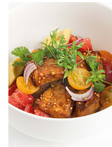
☞ Хрустящие баклажаны Crispy eggplants 190 r 790P