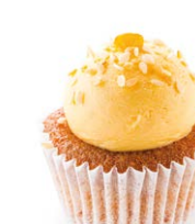
Манго-малина Mango & raspberry 25 r