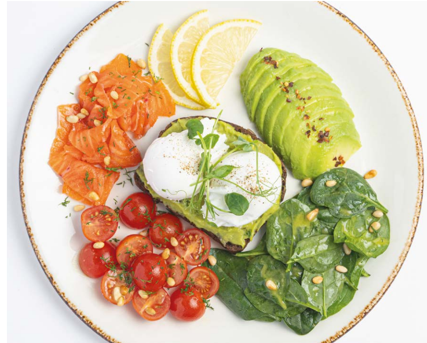
«Завтрак Чемпиона» с яйцом пашот, лососем и авокадо "Champion's breakfast" with poached egg, salmon & avocado 300 г 335 ккал 940P