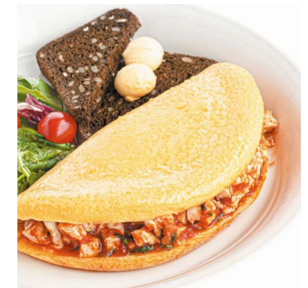
Омлет «Мексиканский» с курицей Mexican omelette with chicken 320/80 г 790P