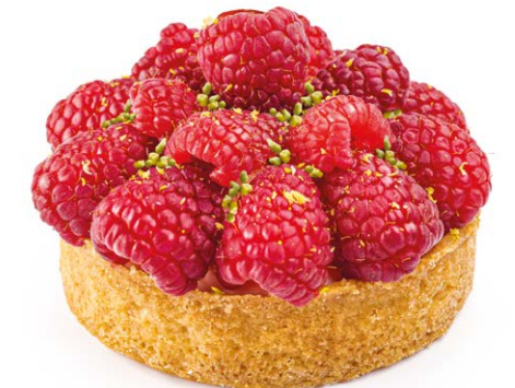
- с малиной with raspberry 120 r 820P