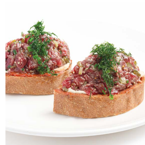
Тартар из говядины на гречишной брускетте Beef tartare on buckwheat bruschetta 130 r 890P