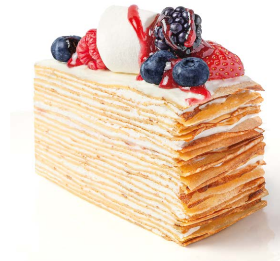
Торт блинный с ягодами Crepe cake with berries 250 r 790P