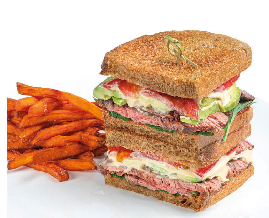
Сэндвич с ростбифом и бататом фри Roast beef sandwich with sweet potato fries 280/80 r 1290P