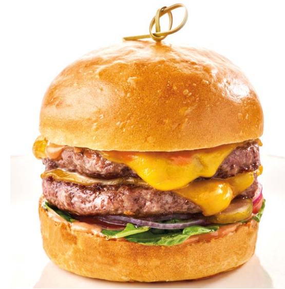
- Двойной чизбургер / Double cheeseburger 350 r 890P - Чизбургер / Cheeseburger 230 r 750P