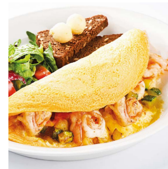
Омлет «Санта-Фе» с креветками, цукини и творожным сыром Omelette "Santa Fe" with prawns, zucchini & cream cheese 280/80 г 890P