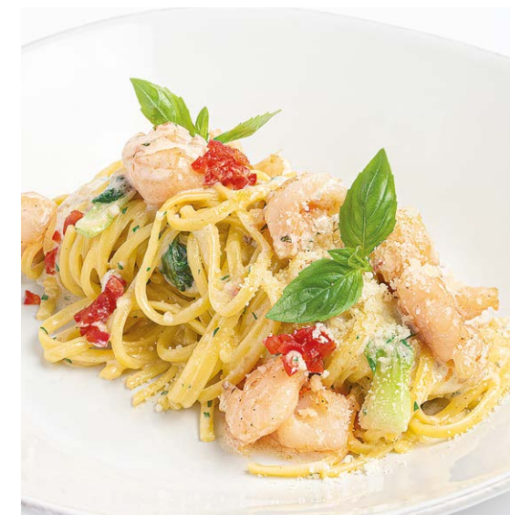
Паста лингвини с гребешком и креветками Linguine pasta with scallops and shrimp 240 r 1070P