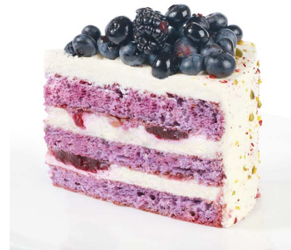
Черничные ночи Blueberry nights 225 r 820P