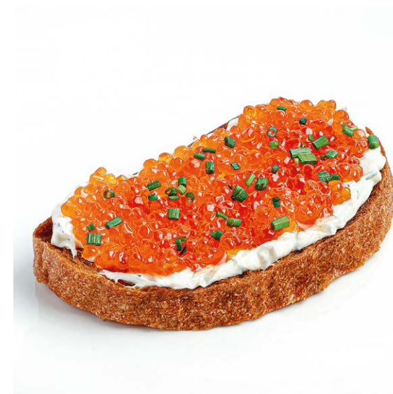
Брускетта с красной икрой Bruschetta with red caviar 120 r 990P