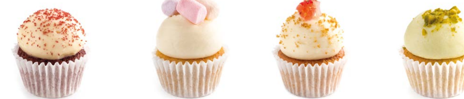
Красный бархат Red velvet 25 r