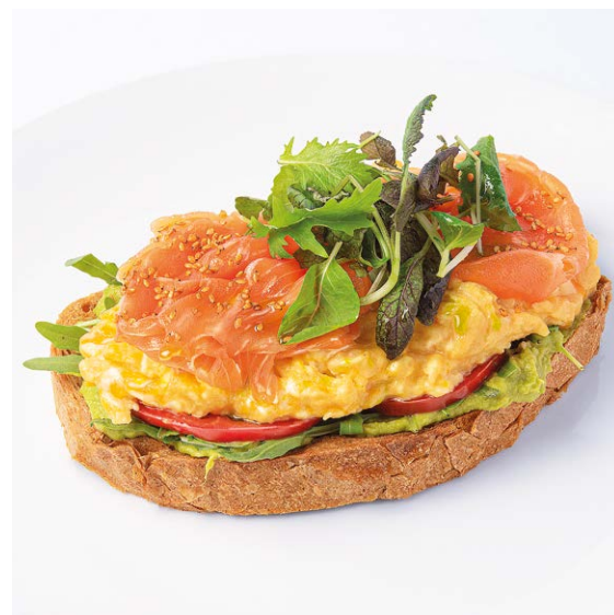
Яйца скрембл на ржаном тосте Scrambled eggs on rye toast - с лососем / with salmon 380 r 990P - с пармской ветчиной / with Parma ham 380 r 990P - с индейкой пастроми / with turkey pastrami 380 r 870P