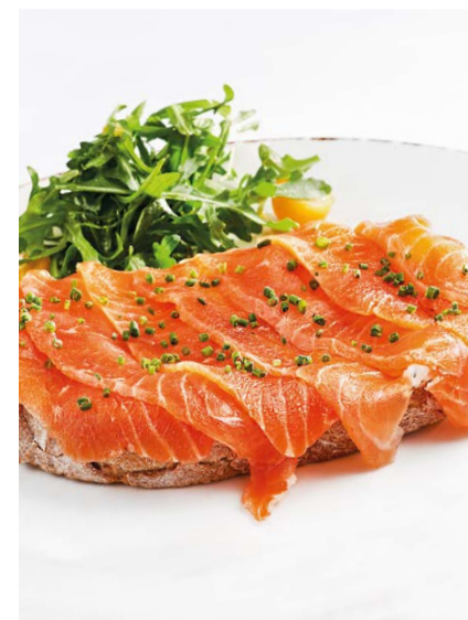
Брускетта с лососем и творожным сыром Bruschetta with salmon & cream cheese 125/15 r 860P