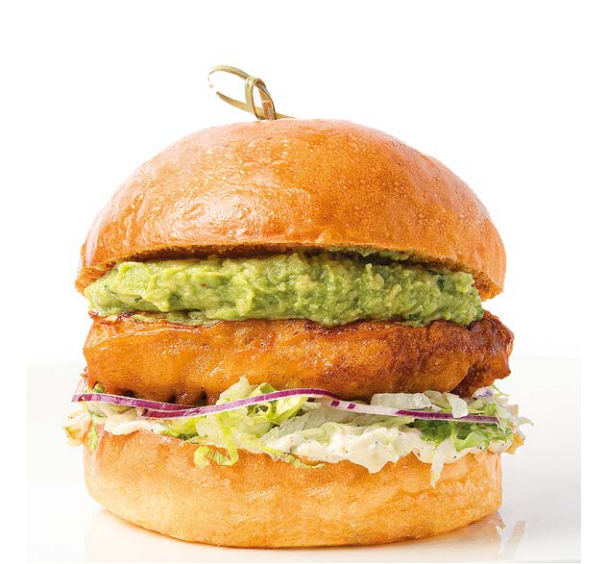
Бургер с курицей Chicken burger 250 r 690P