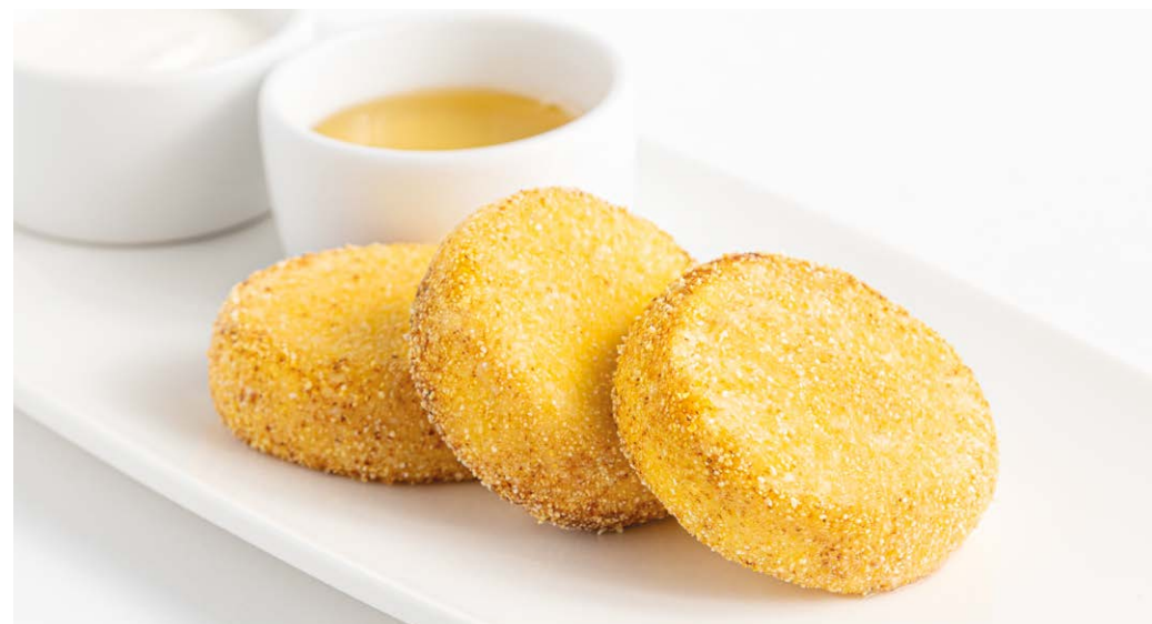
Сырники с мёдом и сметаной Cheese cakes "Syrniki" with honey & sour cream 160/50/40 r 750P