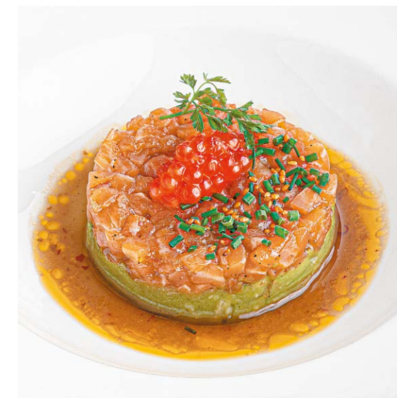
Тартар из лосося Salmon tartare 150/15 r 960P