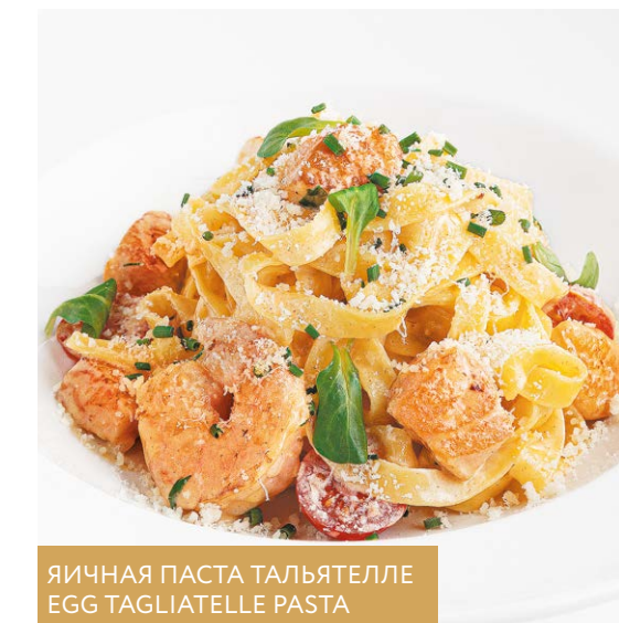
ЯИЧНАЯ ПАСТА ТАЛЬЯТЕЛЛЕ EGG TAGLIATELLE PASTA

- с мягким сыром страчателла / with stracciatella 330 r 890P - с мягким сыром страчателла и куриной грудкой / with stracciatella & chicken breast 390 r 990P - с мягким сыром страчателла и креветками / with stracciatella & shrimp 360 r 1070P