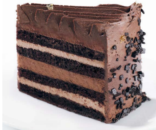
Шоколадная симфония Chocolate symphony 155 r 740P