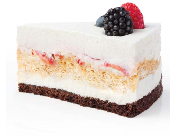
Фирменный торт удскафе Signature cake udcafe 185 r 820P