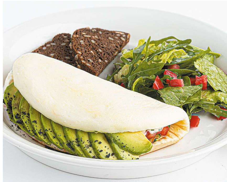
Белковый омлет с авокадо Protein omelette with avocado 300/50 г 329 ккал 820P