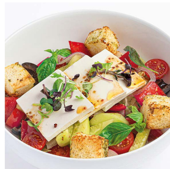
Греческий салат Greek salad 340 r 890P

- с креветками / with prawns 260 r 960P - с лососем / with salmon 290 r 1090P - с говяжьей вырезкой / with beef 240 r 990P