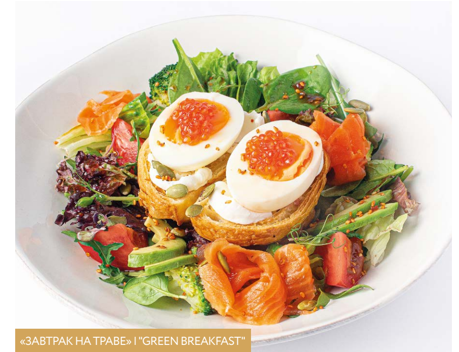
«ЗАВТРАК НА ТРАВЕ» | "GREEN BREAKFAST"