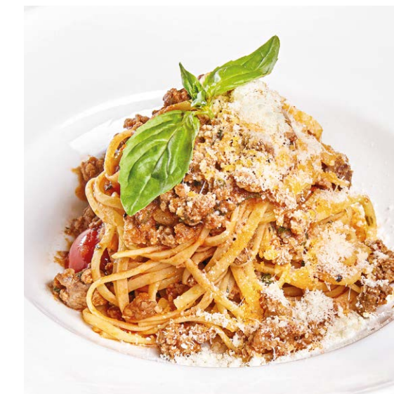
Паста Болоньезе Pasta Bolognese 310 r 920P

- в томатном соусе / with tomato sauce 280 r 560P - с курицей / with chicken 330 r 680P - с креветками / with prawns 320 r 780P