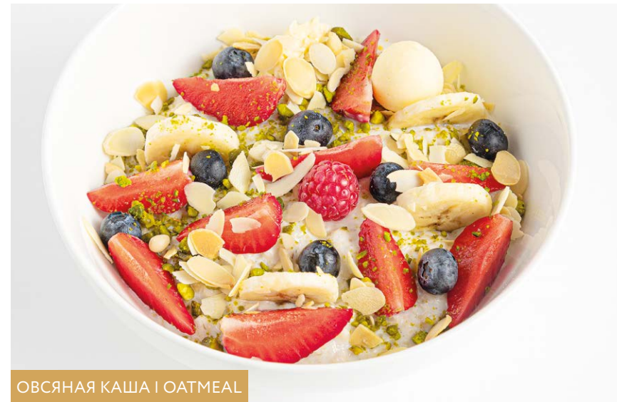
ОВСЯНАЯ КАША | OATMEAL