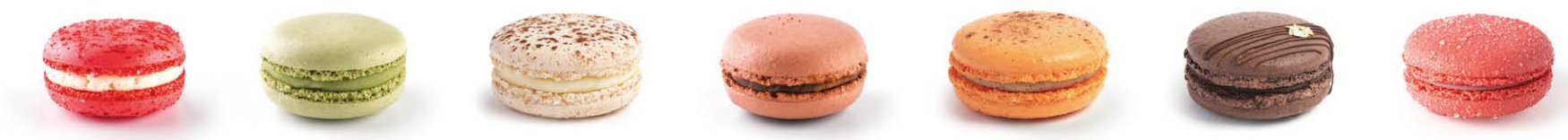
Красный бархат Red velvet