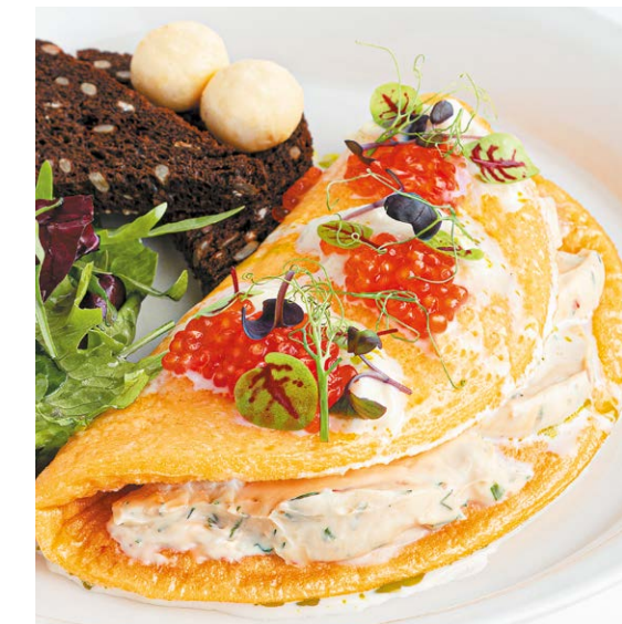
Омлет с мягким сыром страчателла и красной икрой Omelette with stracciatella soft cheese & red caviar 270/80 г 990P + мясо краба / crab meat 20 г 280P