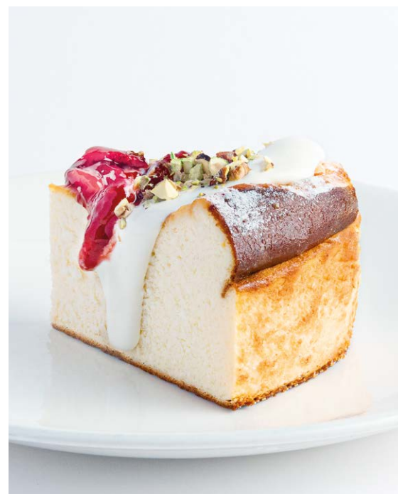
Творожная запеканка со сметаной и клубничным вареньем Farmer's cheese cake with sour cream & strawberry jam 150/40 r 720P