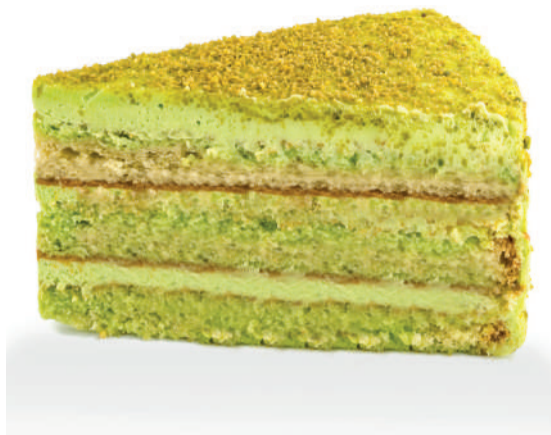
Фисташковый торт Pistachio cake 170 g 570P