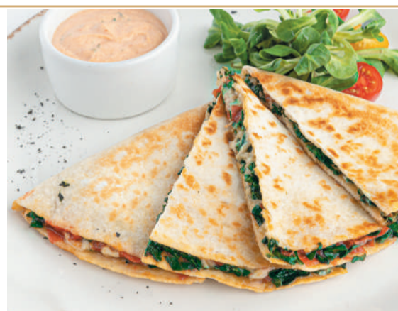
Кесадилья со шпинатом и моцареллой Quesadilla with spinach & mozzarella 270/40/25 g 740P