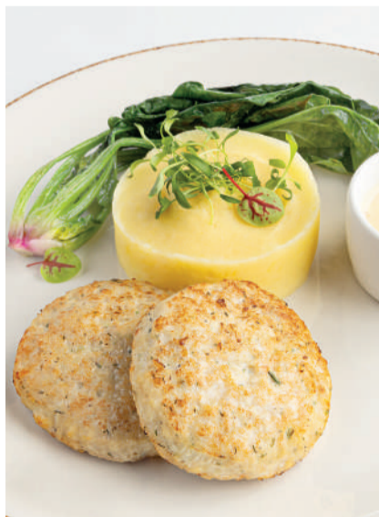
Куриные котлеты с трюфельным пюре Chicken cutlets with truffle mashed potatoes 110/160/40 g 690P