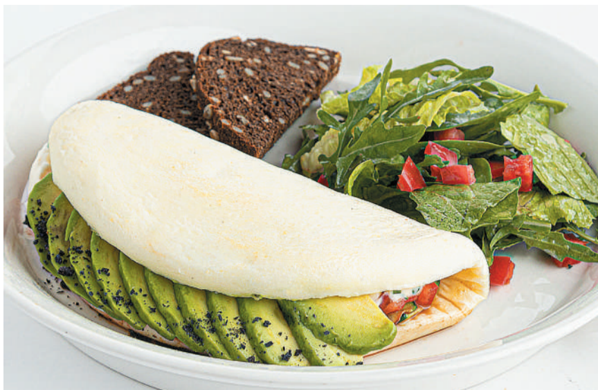
Белковый омлет с авокадо Protein omelette with avocado 300/50 g 329 kcal 720P