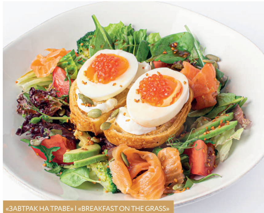
«ЗАВТРАК НА ТРАВЕ» | «BREAKFAST ON THE GRASS»