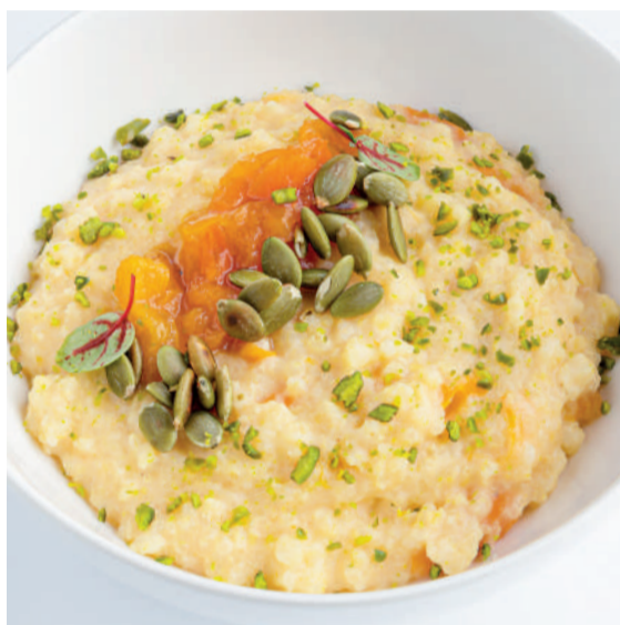
Каша пшенная с курагой Millet porridge with dried apricots 320 g 470P