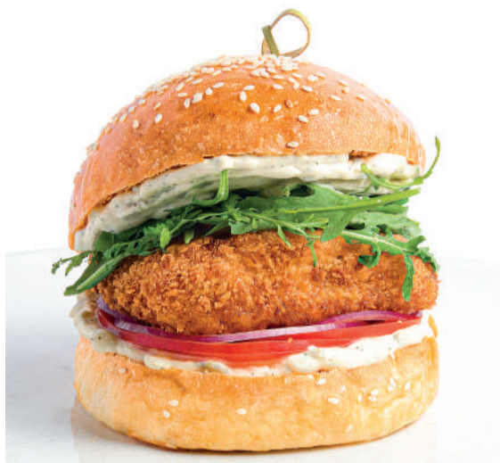
Фиш бургер Fish burger 260 g 620P