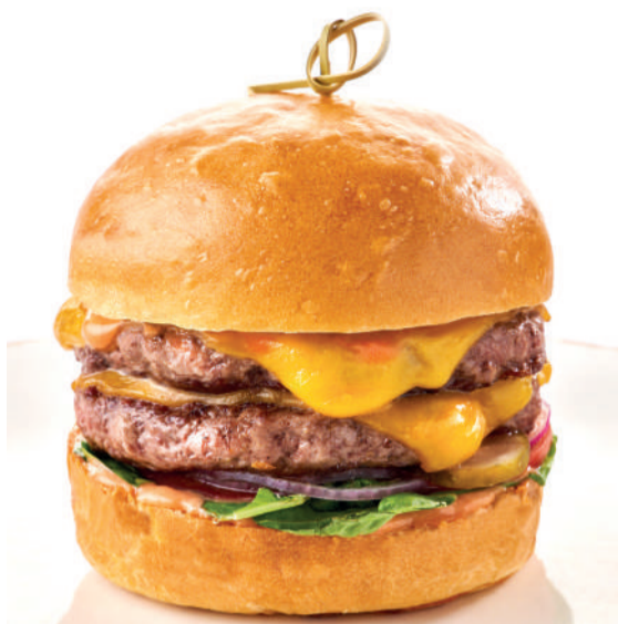
Дабл чизбургер Double cheeseburger 350 g 760P