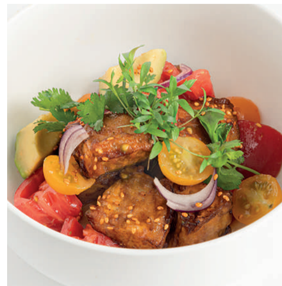
Хрустящие баклажаны Crispy eggplants 190 g 690P