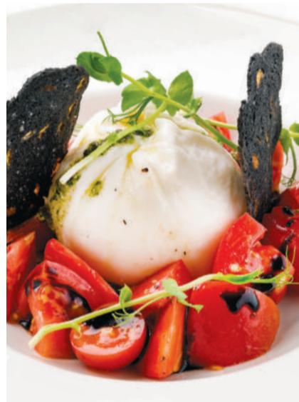
Буррата с томатами Burrata with tomatoes 230 g 890P