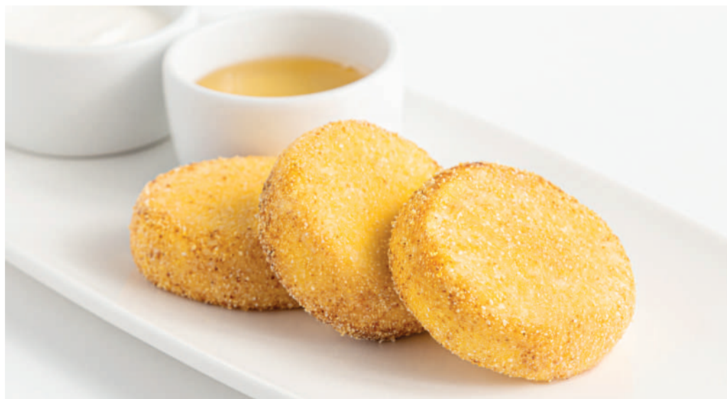
Сырники с мёдом и сметаной

Cheese cakes «Syrniki» with honey & sour cream 160/50/40 g