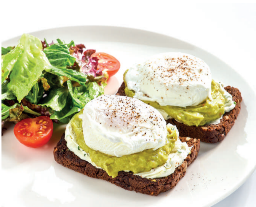
Яйца пашот на тостах из черного злакового хлеба с крем-чизом Poached eggs with cream cheese on cereal bread toasts 250 g 296 kcal 580P