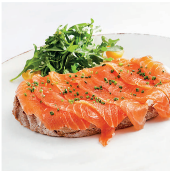
Брускетта с лососем и воздушным крем-чизом Bruschetta with salmon & cream cheese 125/15 g 720P