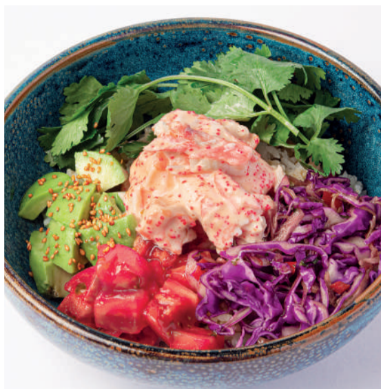
Теплый боул с крабом и яйцом пашот Warm crab bowl with poached egg 380 g 970P