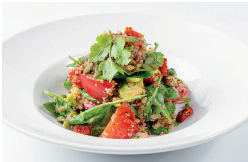
Киноа с томатами и авокадо Quinoa with tomatoes & avocado 250 g 239 kcal 620P