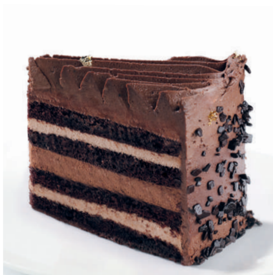
Шоколадная симфония Chocolate symphony 155 g 580P