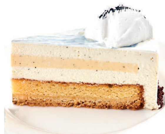
Пломбир Ice-cream 170 g 570P