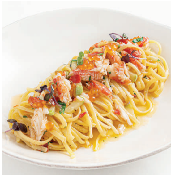
Лингвини с крабом Linguine with crab 330 g 1100P