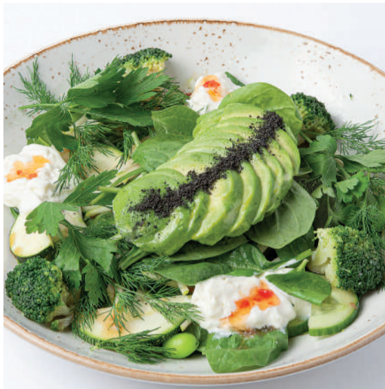
Большой зеленый салат со страчателлой Big green salad with stracciatella 310 g 840P - с куриной грудкой / chicken breast 370 g 940P - с креветками / with prawns 350 g 970P