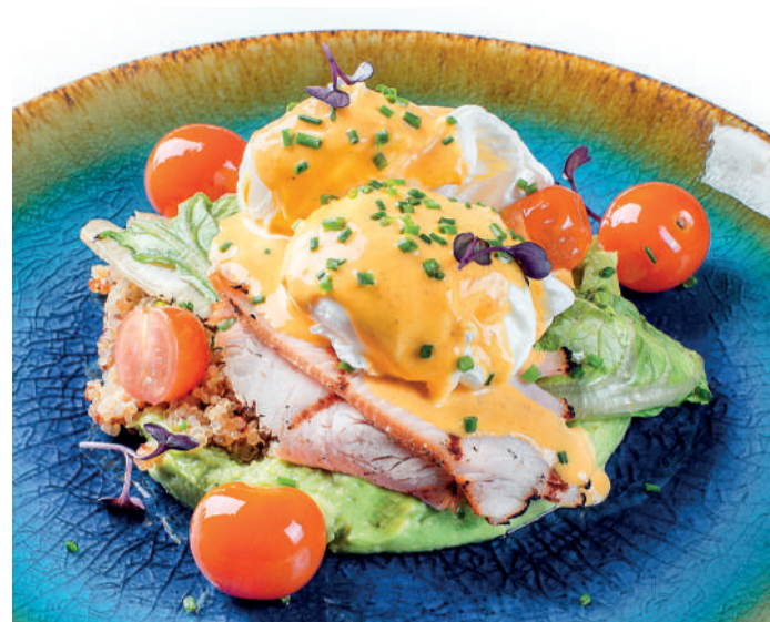
Завтрак «Фаворит» с киноа, яйцом пашот и пастромой из индейки «Favorite» breakfast with quinoa, poached egg & turkey pastrami 330 g 720P