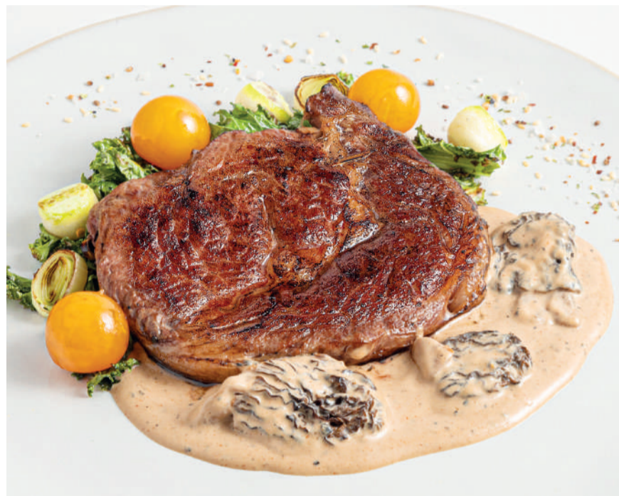
Стейк Рибай Ribeye steak 200°/100 g 2200P