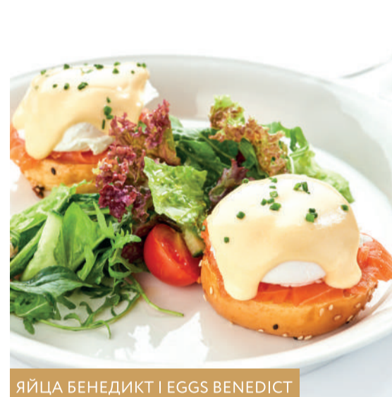
ЯЙЦА БЕНЕДИКТ | EGGS BENEDICT