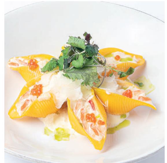
Паста с крабом и креветками Pasta with crab & prawn 220 g 920P