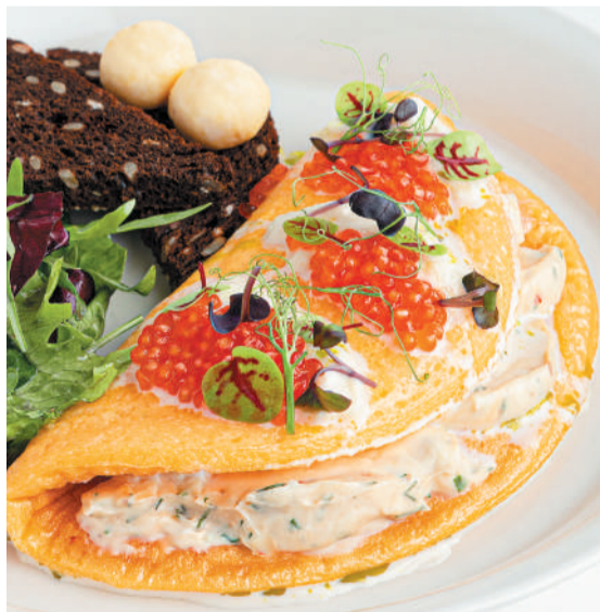
Омлет со страчателлой и красной икрой Omelette with stracciatella & red caviar 270/80 g 890P