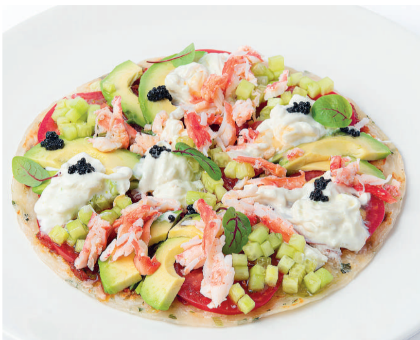
Краб и страчателла на лепешке роти парата с авокадо, огурцом, томатами Crab and stracciatella cheese on a flatbread paratha with avocado, cucumber & tomatoes 310 g 1100P