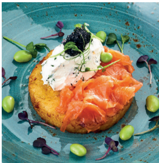
Драник с лососем «Dranik» with salmon 145/30 g 670P