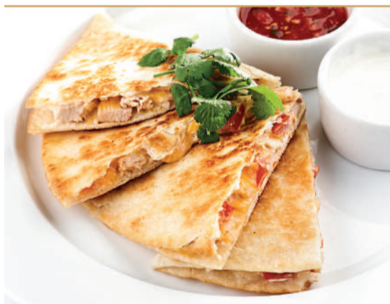
Кесадилья с курицей Quesadilla with chicken 210/50/50 g 670P

По вашему желанию мы можем приготовить блюдо острым We can make the dish spicy if you wish