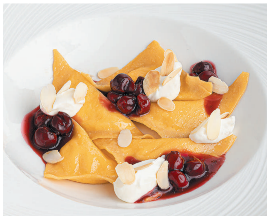
Вареники с творогом