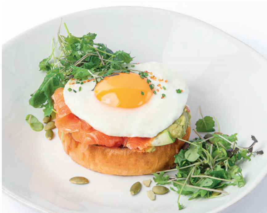
Завтрак на бриошь с глазуньей Breakfast on a brioche bun with a fried egg - с лососем / with salmon 190 g - с креветками / with prawns 200 g - с бифштексом / with beefsteak 220 g