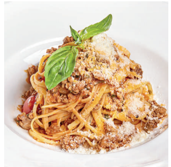
Лингвини Болоньезе Linguine Bolognese 310 g 750P