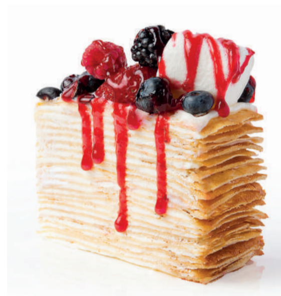
Торт блинный с ягодами Crepe cake with berries 250 g 690P

Ягодный чизкейк Berry cheesecake 210 g 640P