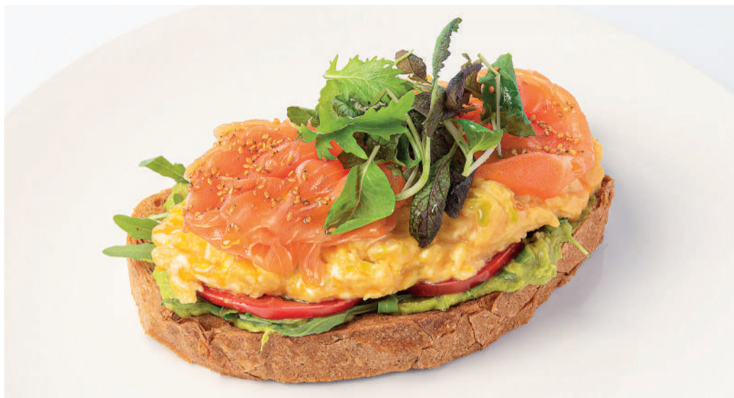
Скрембл на ржаном тосте с гуакомоле