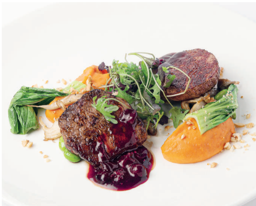
Медальоны с пюре из корнеплодов Medallions with mashed root vegetables 120°/150 g 1190P