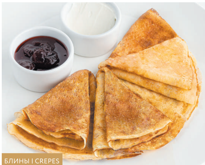
БЛИНЫ | CREPES