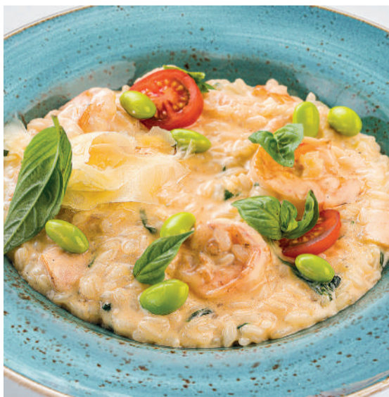
🍷 Ризотто с лососем и креветками Risotto with prawns & salmon 320 g 890P