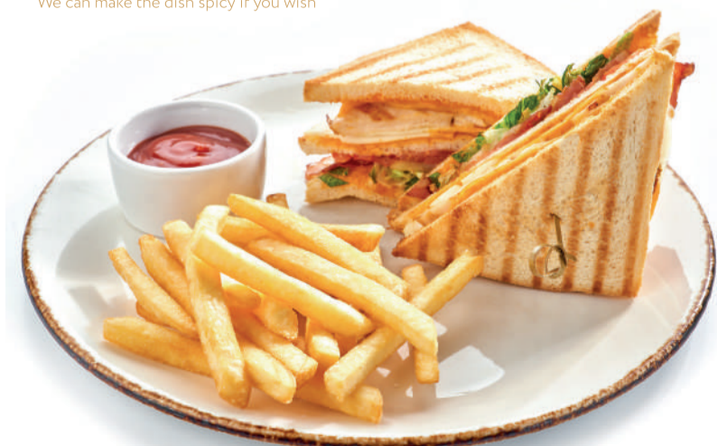
Клуб сэндвич с курицей, беконом и картофелем фри Club sandwich with chicken, bacon & French fries 250/80/30 g 720P