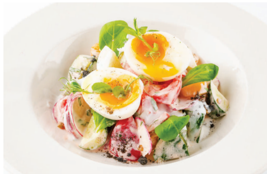
Овощной салат Vegetable salad 270 g 149 kcal 590P