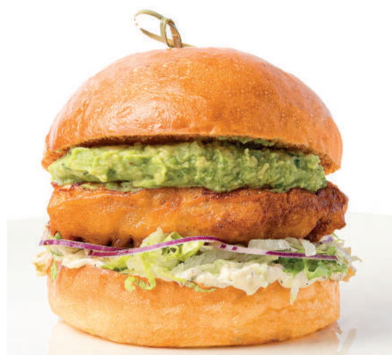
Чикенбургер Chicken burger 250 g 580P