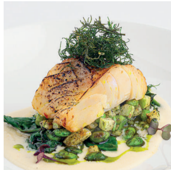
Атлантическая треска с соусом берблан Atlantic cod with beurre blanc sauce 110/100 g 920P