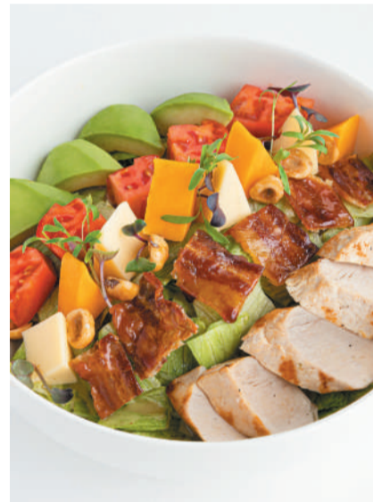
Кобб салат с индейкой и карамелизированным беконом Cobb salad with turkey & caramelized bacon 370 g 820P