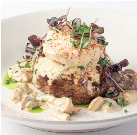
Бифштекс с белыми грибами, яйцом пашот и лепешкой роти парата Beefsteak with porcini mushrooms, poached egg and roti paratha flatbread 150/100/70 g 890P