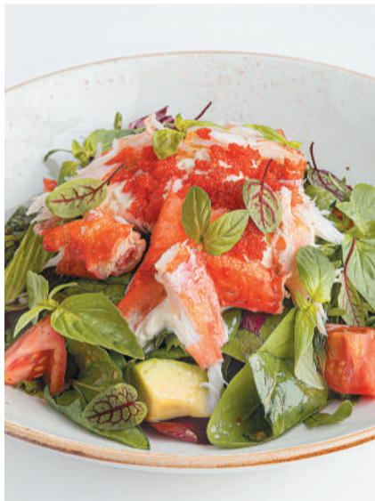
Камчатский краб с авокадо, страчателлой, томатами и икрой летучей рыбы Kamchatka crab with avocado, stracciatella, tomatoes & flying fish caviar 260 g 1100P