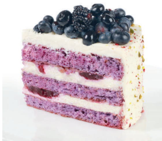
Черничные ночи Blueberry nights 225 g 690P