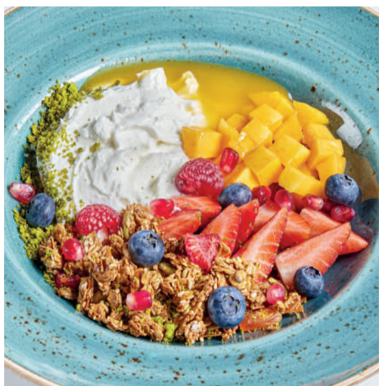
Творожный боул с гранолой Curd & granola bowl 230 g 690P