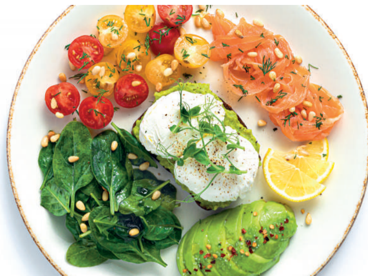
«Завтрак Чемпиона» с яйцом пашот, лососем и авокадо «Champion's breakfast» with poached egg, salmon & avocado 300 g 270 kcal 840P