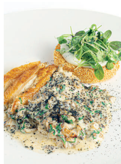
Куриная грудка с жульеном и хрустящей полентой Chicken breast with julienne & crispy polenta 130/140 g 790P