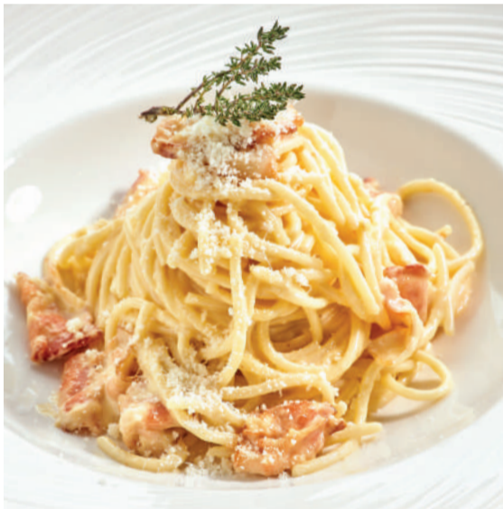
Спагетти Карбонара Spaghetti Carbonara 230 g 680P