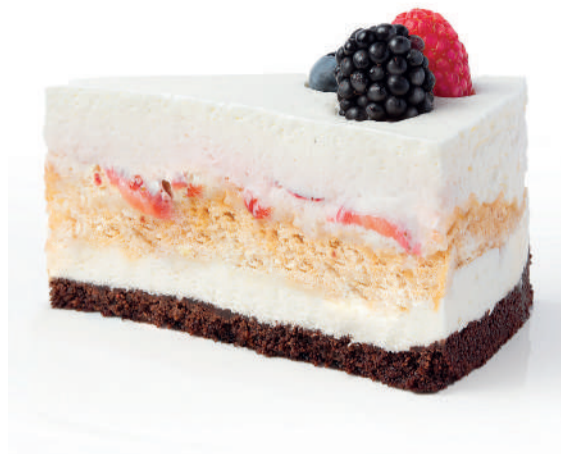
Фирменный торт удскафе Signature cake удскафе 185 g 690P