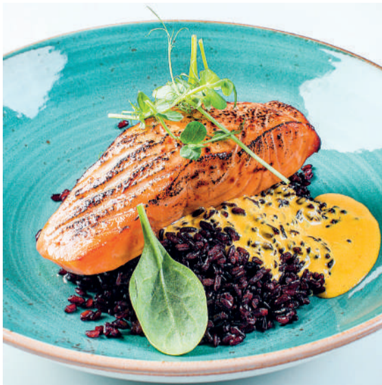
Лосось с черным рисом Salmon with black rice 85/150 g 1190P