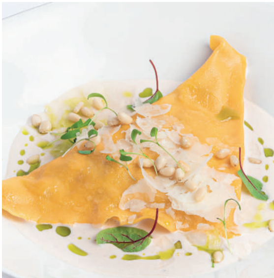
Гранд равиоль с белыми грибами Grand porcini mushrooms raviolo 90/50 g 620P