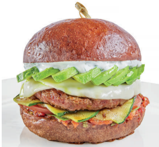
Атлет The Athlet 320 g 680P