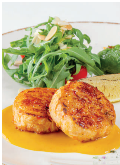
Кrab-кейки с авокадо Crab cakes with avocado 100/100 g 870P