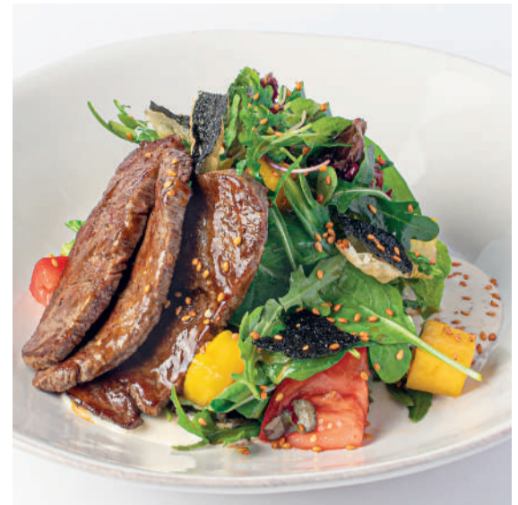
Азиатский салат с мраморной говядиной Asian salad with marbled beef 210 g 890P