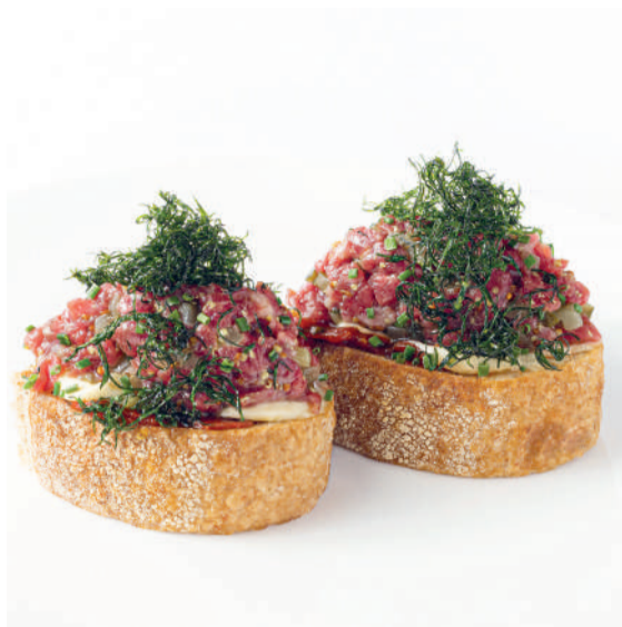
Тартар из говядины на гречишной брускетте Tartare beef on buckwheat bruschetta 130 g 680P