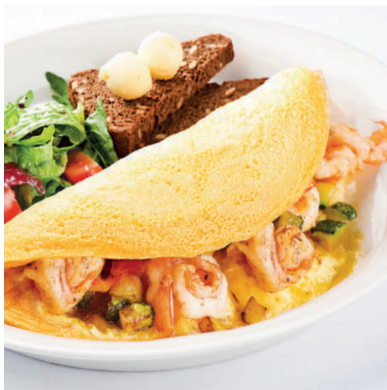
Омлет «Санта Фэ» с креветками, цукини и крем-чизом Omelette «Santa Fe» with prawns, zucchini & cream cheese 280/80 g 770P