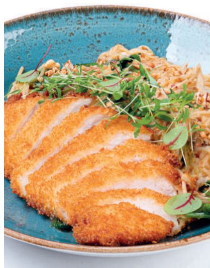
Рамен с цыпленком Chicken ramen 420 g 750P