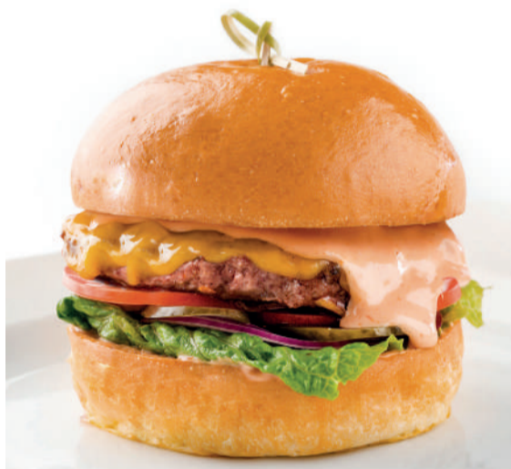
Чизбургер Cheeseburger 230 g 590P