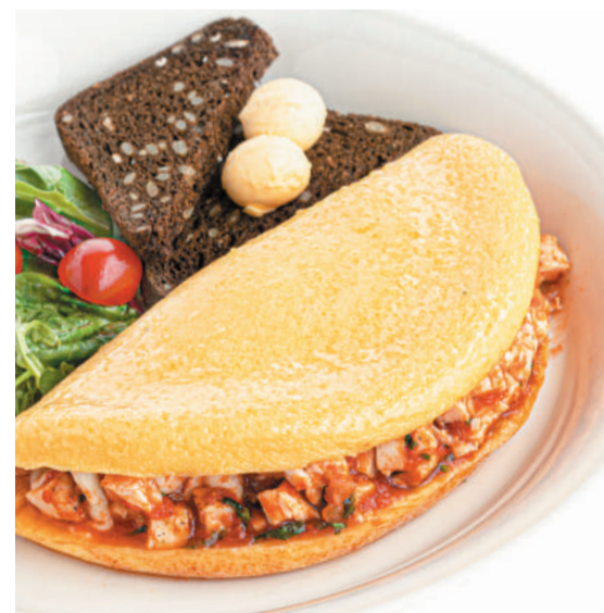
Омлет «Мексиканский» с курицей «Mexican» omelette with chicken 320/80 g 670P