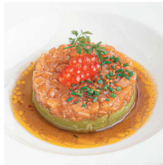
Тартар из лосося Salmon tartare 150/15 g 790P