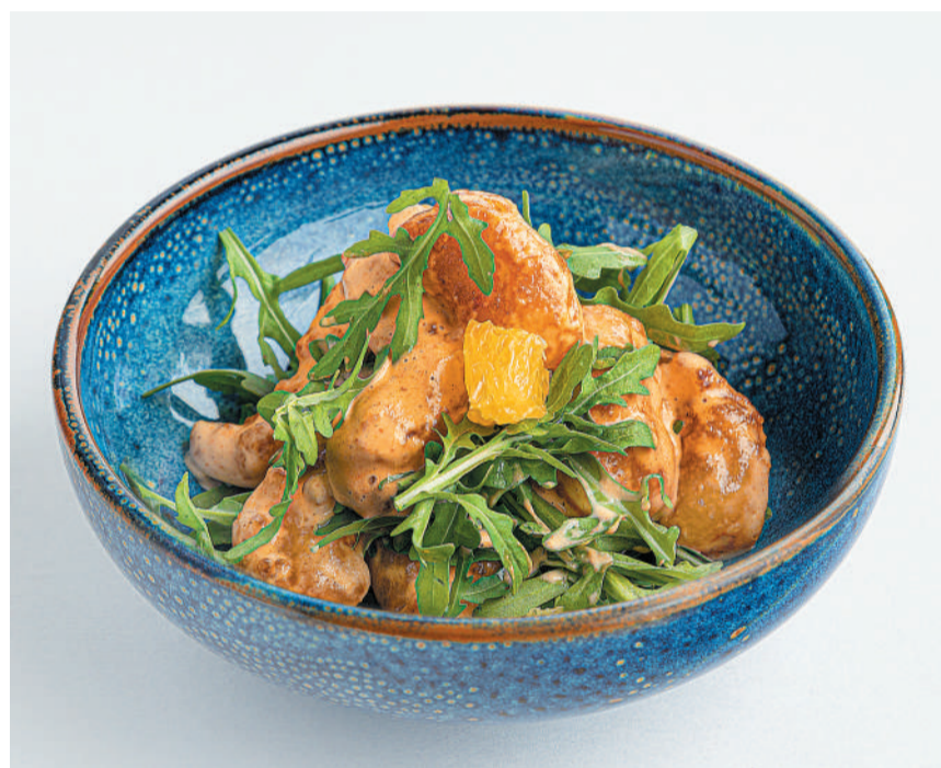
Креветки попкорн Prawns popcorn 120/25 g 650P