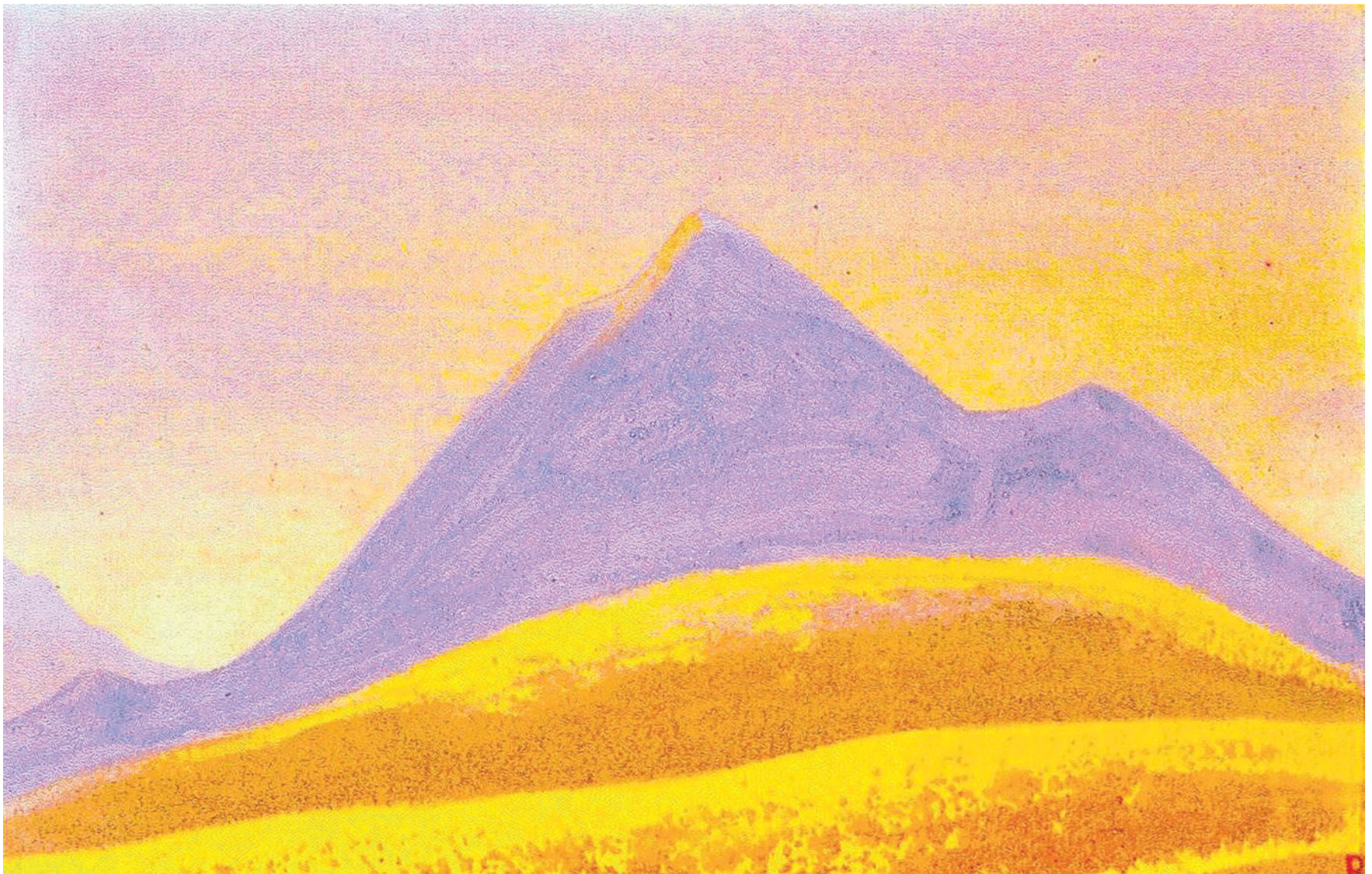
Н.К. РЕРИХ «ГИМАЛАИ»