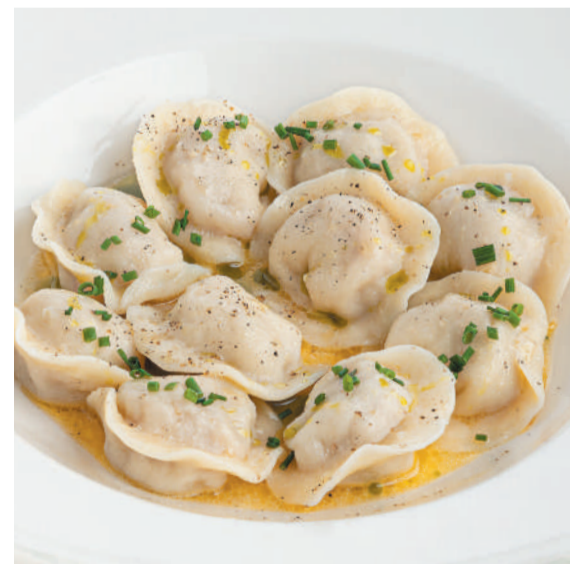
Пельмени с говядиной Beef dumplings 200/30 g 650P