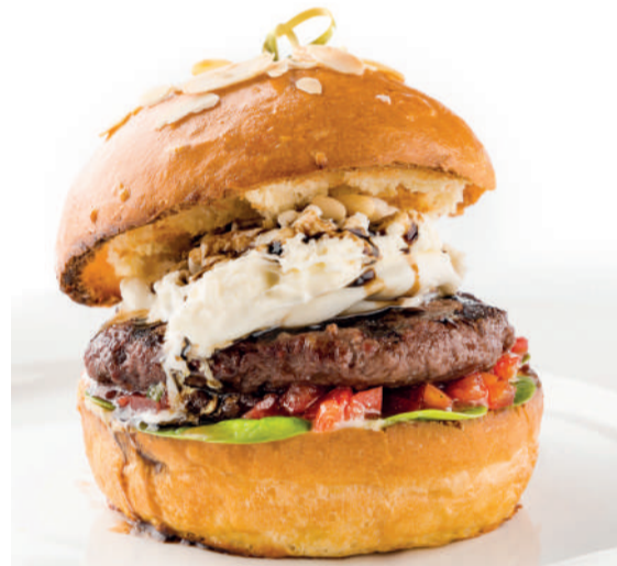
Буррата Burrata burger 280 g 720P